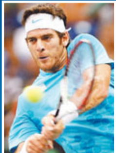
■迪樸祖去年世界排名勁升。資料圖片

迪樸祖在2010年因接受一次手腕手術，結果整季只打了6場比賽，去年宣布回歸網壇，1月時，世界排名低至位列第485位，但年終世界排名已急升至第11位，結果獲選奪得去年ATP世界巡迴賽年度最佳復出獎，這名阿根廷球星能否在新球季挑戰「四大天王」祖高域、拿度、費達拿和梅利，再奪大滿貫錦標甚至挑戰四人的世界排名，令人期待。