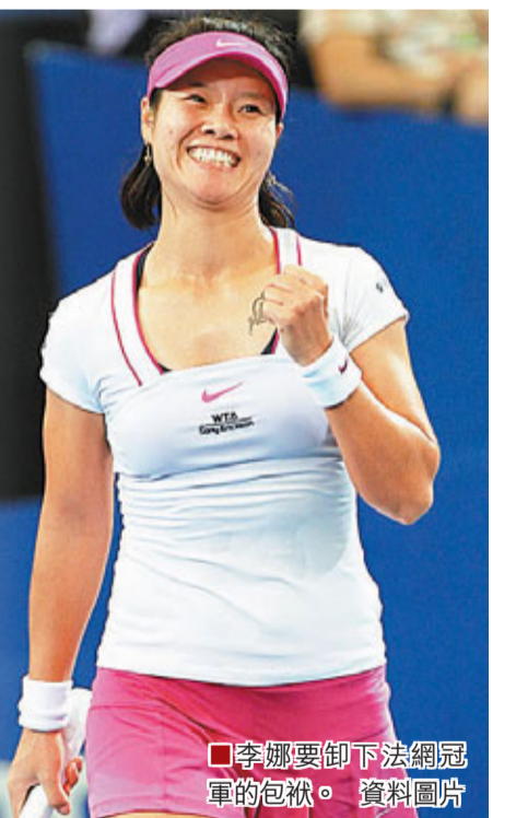
■李娜要卸下法網冠軍的包袱。資料圖片

上賽季，中國女網曾首度有2名世界排名前15位的球手，包括李娜和彭帥，其中彭帥以年終世界排名第16位收官，創造了個人職業生涯最佳，雖然光芒不及娜姐燦爛，但彭帥在四大滿貫中都有突破，世界排名也一度高達第14位，還獲得參加有WTA小年終賽之稱的峇里島賽事，新球季彭帥的表現更值得期待。