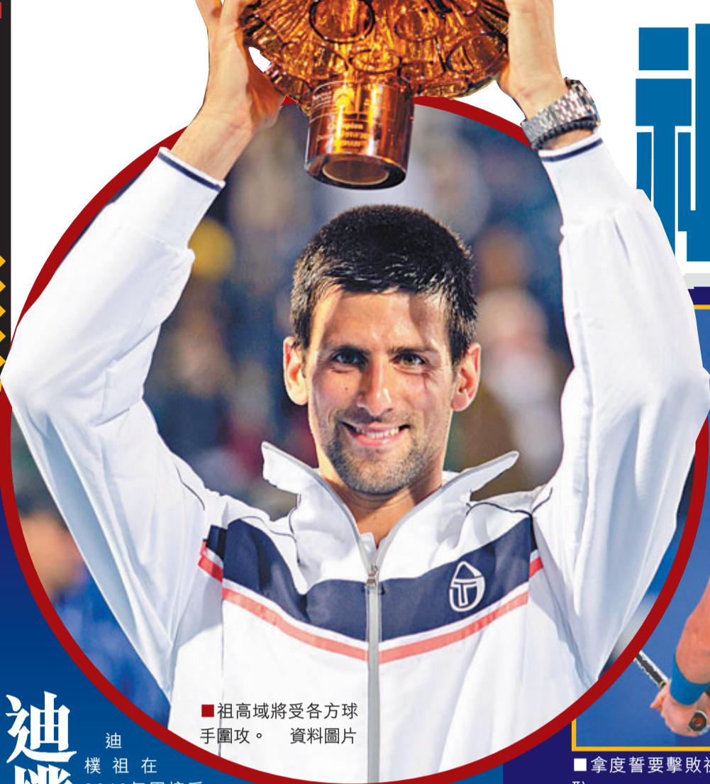
■祖高域將受各方球手圍攻。資料圖片