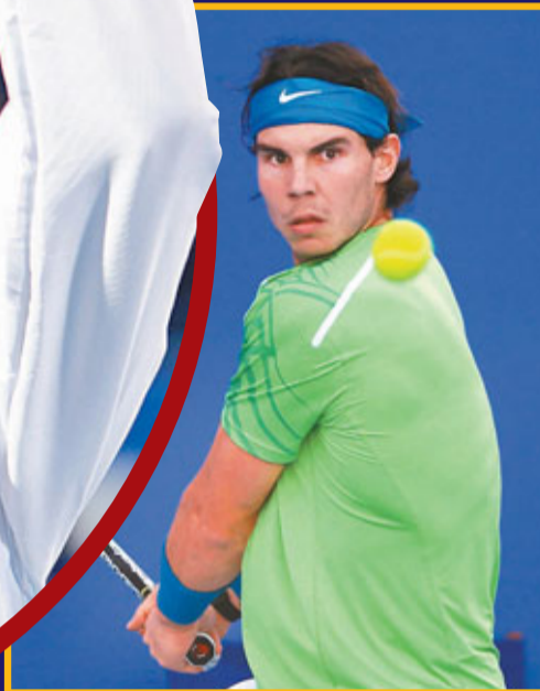
■拿度誓要擊敗祖高域一報去年6戰全敗之恥。資料圖片