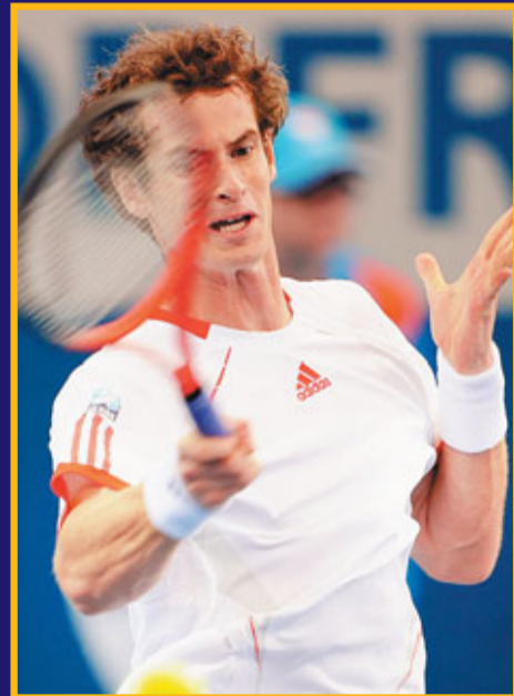
■梅利已聘請蘭度任教練衝擊大滿貫錦標。資料圖片