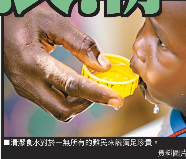
清潔食水對於一無所有的難民來說彌足珍貴。資料圖片

"Global Trends 2010", United Nations Higher Commissioner for Refugees (UNHCR) http://www.unhcr.org/cgi-bin/texis/vtx/home/opensslPDFViewer.html?docid=4dfa11499&query=Global%20Trends%202011