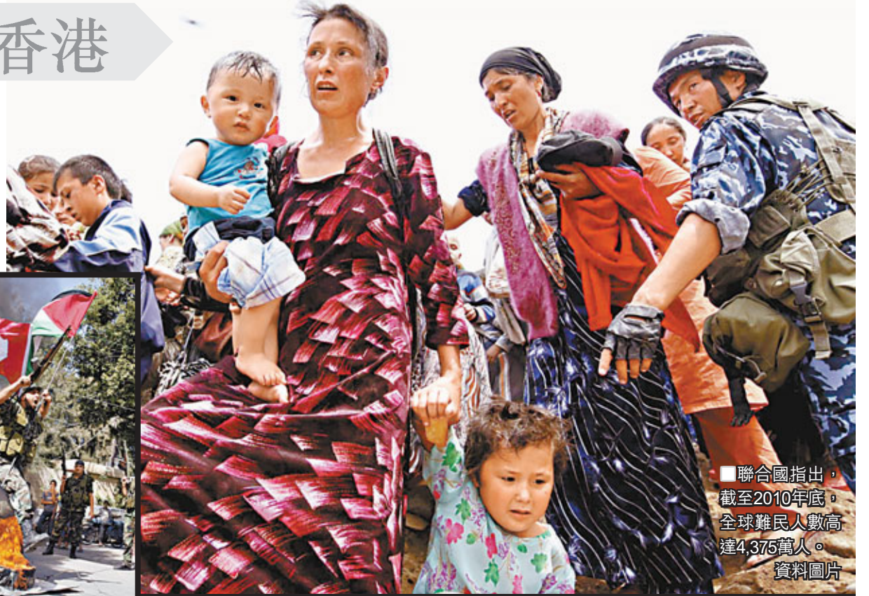
聯合國指出，截至2010年底，全球難民人數高達4,375萬人。資料圖片