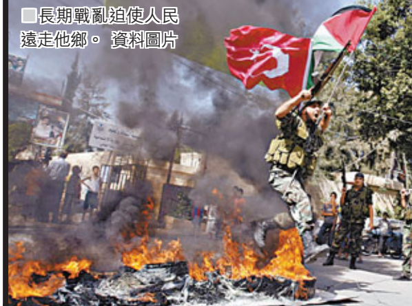
長期戰亂迫使人民遠走他鄉。資料圖片