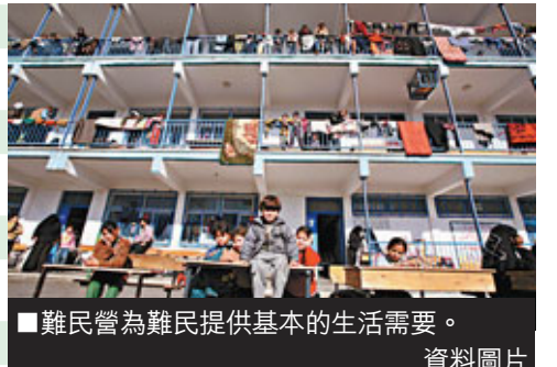
難民營為難民提供基本的生活需要。資料圖片

難民署主要進行有關人道主義、社會和非政治的工作。它常以外交中間人的身份出現，在有政府組織和個人的協助下，實施各項援助難民的方案，對其提供國際保護，幫助他們自願遣返或歸化於新定居的國家。但該組織並不負責處理全球所有的難民問題，如已由庇護國承認為該國國民的難民，以及已由聯合國其他機構管理的難民，則不會由難民署負責。