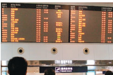
2日，大霧襲擊重慶，機場航班大片延誤或取消。圖為人們在看航班信息。

香港文匯報訊 2日凌晨，新疆塔城地區瑪依塔斯風區遭風雪襲擊，235名旅客和63輛車被困在暴風雪中。經過3個多小時救援，被困人員和車輛被成功營救到安全地帶。據新華網消息，新疆塔城公路局領敏分局介紹，1日23時許，瑪依塔斯風區颶起8—9