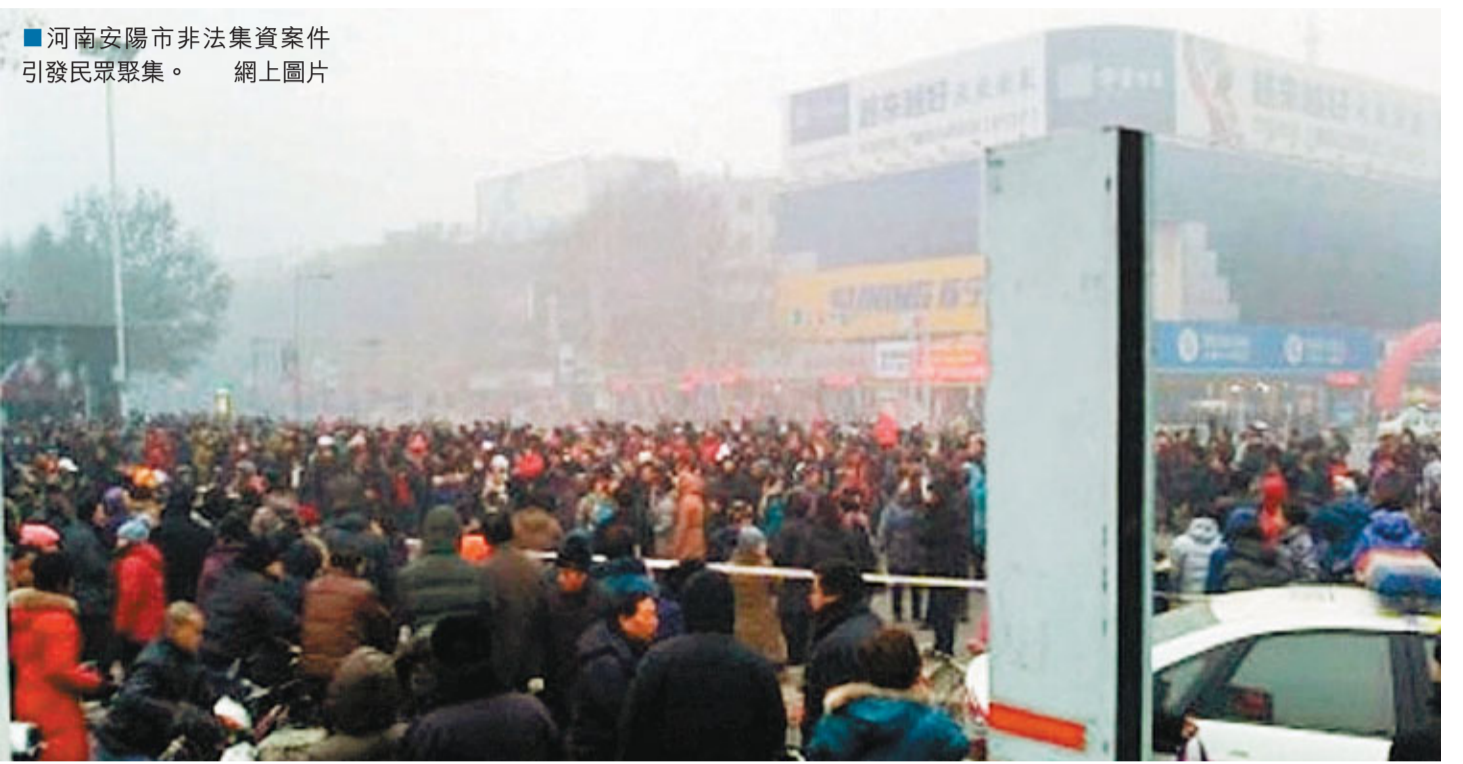
河南安陽市非法集資案件引發民眾聚集。

在資產處置過程中，相關辦案人員一定要嚴格按照法定程式依法處置、公開處置。要進一步核準參與非法集資的群眾人數、集資情況，為兌付工作打好堅實基礎。要想方設法做好穩控工作，讓集資群眾代表參與資產