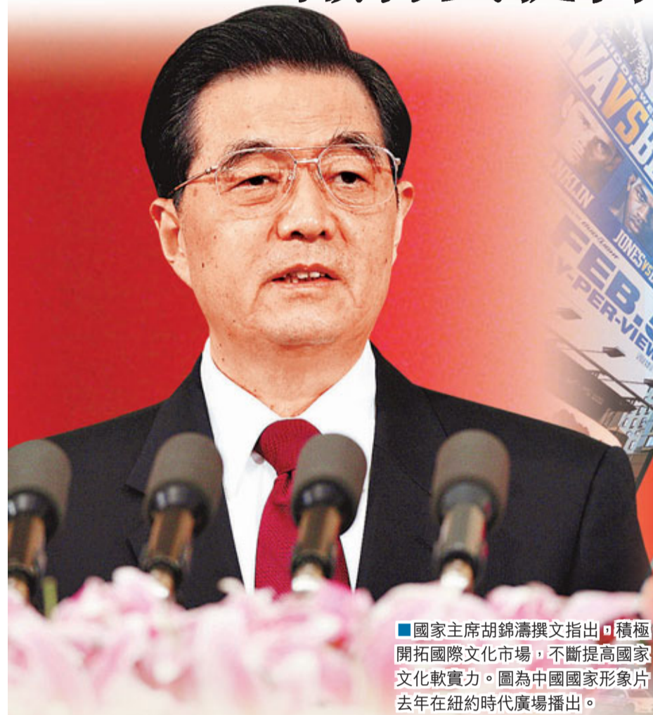
■國家主席胡錦濤撰文指出，積極開拓國際文化市場，不斷提高國家文化軟實力。圖為中國國家形象片去年在紐約時代廣場播出。