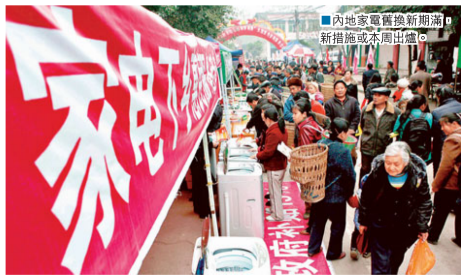
■內地家電舊換新期滿，新措施或本周出爐。

香港文匯報訊 據中廣網報道，2011年12月31日是內地家電「以舊換新」政策執行的最後一天，不少消費者爭相趕搭「末班車」。商務部表示，新的消費促進措施，有望在今年初舉行的全國商務工作會議上公佈。