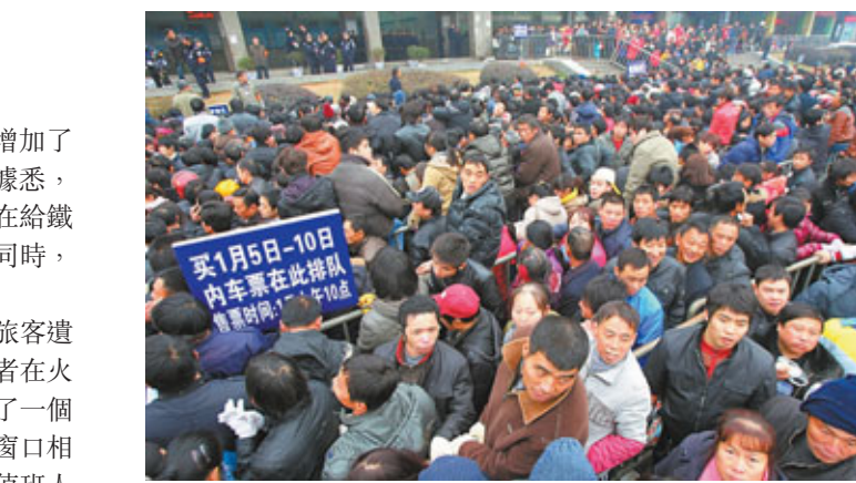
實名制下，遺失車票不能補領，也不能購同一班列車。圖為元旦日鐵路紹興站售票大廳外排着長長的購票隊伍。

實名制：堵住黃牛 失證不便 在廣州火車站，除了大量的人流，記者發現增加了許多標語，其中很多是對實名火車票的提醒。據悉，今年火車票實名制全面鋪開，在給鐵路部門打擊黃牛黨帶來便利的同時，亦給部分旅客帶來一些麻煩。除了遺失火車票，還有一些旅客遺失身份證，導致無法上車。記者在火車站售票大廳發現，車站特設了一個「臨時證件辦理窗口」。與售票窗口相比，該窗口的排隊人數更多。值班人員介紹，這些都是身份證或其他證件遺失的旅客。這些旅客，若希望買到票，只要報上自己的證件號碼，就可以到臨時身份證明。不過，需要有人擔保或者單位的蓋章證明。