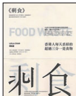
書名：剩食 作者：陳曉蕾 出版：三聯 (香港) 出版日期：2011年7月 定價：港幣108元

「剩食」的荒謬在於，它本來也是食物，只不過因為種種利潤考慮而被「廢棄」，而「廢棄」就