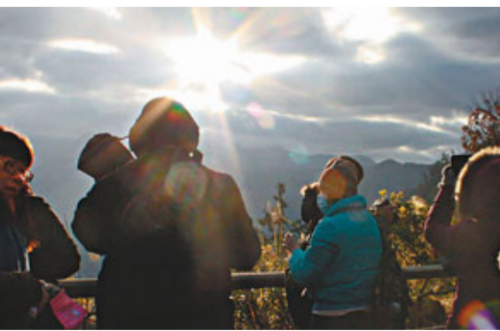
■2012年阿里山第一道曙光因厚雲而姍姍來遲。中央社

據中央社1日電 阿里山清晨氣溫只有攝氏2、3度左右，冷冽寒風擋不住1萬7000多名民眾，迎接2012年曙光的熱情，摸黑登上海拔2600公尺高的阿里山「對高岳觀日台」。其中不少更是一夜沒睡，參加完山下跨年晚會就上山的朋友，他們一致的希望就是要看到日出，感受日出之美。