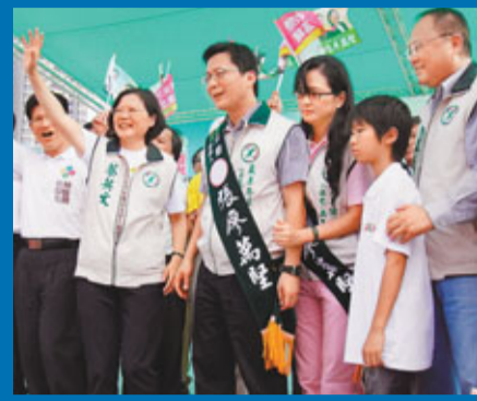
■蔡英文加緊為立委候選人站台，鞏固台中綠營力量。中央社