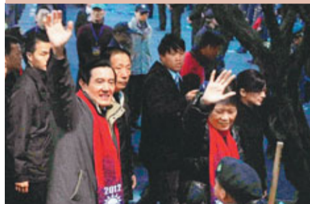
■元旦升旗禮後，馬英九和夫人周美青走進人群。

據中通社1日電 1月1日新年第一天，台灣主要政治人物都對未來許下新的期望和目標。馬英九在祝詞中，雖然未具體提及兩岸關係，但他也意有所指地表示，下個百年的台灣人民，有權利期待一個和平而非戰亂、和諧而非對立、進步而非倒退的年代；他要效法先賢，點燃下世代心中的蠟燭，讓他們發光發亮。