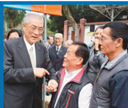
■吳敦義在南投老家時，遇到不少舊識。

綠營方面，儘管定調決戰中台灣，在南投喊出「得票過半」，但輔選人士不諱言，綠營仍須衝刺，希望最後階段達陣。