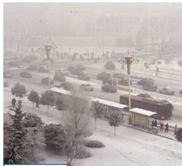
大霧阻行車 中央氣象台1日發布大霧黃色預警,而據河北省氣象台預報,該省局部地區能見度小於200米,個別地點不足50米。圖為受大霧影響,河北省石家莊主幹路車流行駛緩慢。

當天下午3時,晉銜儀式在莊嚴的國歌聲中開始。徐粉林宣讀了中央軍委主席胡錦濤簽署的晉陞將官軍銜命令。張陽主持晉銜儀式。晉陞將官的7位軍官軍容嚴整、精神抖擻地列隊在主席台前,徐粉林、張陽向他們頒發命令狀,並與他們握手表示祝賀。軍區黨委常委、軍區機關四大部領導以及部分團職以上機關幹部參加了晉銜儀式。