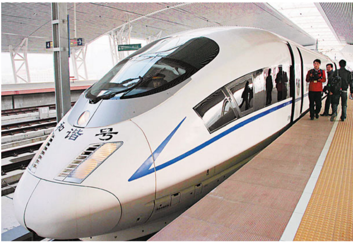
■廣深武廣高鐵路開通運一周,深圳北站累計發送旅客6萬多人次。