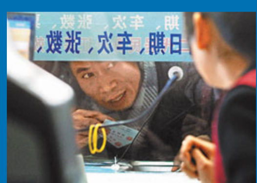
■1日,在杭州汽車東站火車票大賣場購票的旅客手持身份證在窗口前諮詢。

負責人認為,出現高上座率的原因和武廣高鐵的成熟運營有很大關係,元旦期間客流量,以換乘武廣高鐵路為最終目的旅客佔絕大多數,預計春節前客流量將有明顯的增長。