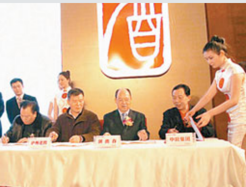
六朵金花負責人現場簽署共建「中國名酒街」協議。

四川省商務廳相關負責人表示,自2010年年初四川啟動「中國白酒金三角」戰略以來,川酒開始呈現強勁的增長勢頭。去年前三季度,四川白酒行業銷售收入已突破千億大關,全年白酒行業主營業務收入有望超過1,400億元。