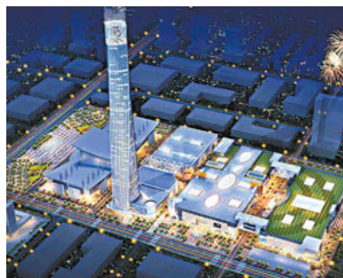
名傢具總部大廈效果圖。

香港文匯報訊(記者 肖郎平、實習記者 王悅 東莞報道)記者日前從東莞名傢具世博園戰略發佈會上獲悉,名傢具世博園一期工程中的名傢具總部大廈日前正式開建。據了解,名傢具總部大廈樓高120層,樓高目前國內排名第四,總面積達150萬平方米,將是東莞新「第一高樓」,同時成爲亞洲規模最大、全球傢具業最具規模的展覽一體化平台,以及國內傢具品牌走出國門的窗口。