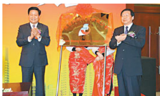
陝西省長趙正永(左)與陝西省委常委、常務副省長婁勤儉爲首家民營主體投資公司揭牌。

香港文匯報訊(記者 熊曉芳 西安報道)陝西首家以民營企業爲主體的投資公司陝西民東投資(集團)有限公司日前在西安正式成立,陝西省長趙正永,省委常委、常務副省長婁勤儉出席成立大會並揭牌。趙正永表示,投資公司成立標誌着民間資本開始聚集進入經濟建設的主戰場,將有效解決閒置民間資本不敢投、不會投、不能投的問題。