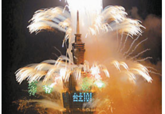
台北101大樓施放煙火慶祝2012年的到來。

香港文匯報訊 綜合台灣媒體消息：從台北101到高雄義大世界，從日月潭到阿里山，全台各縣市精心安排了共24場各具地方特色的大型跨年晚會，準備讓台灣民眾在絢爛煙火、山光水色及藝人的精彩表演中，以欣喜的心情迎接新年的到來。