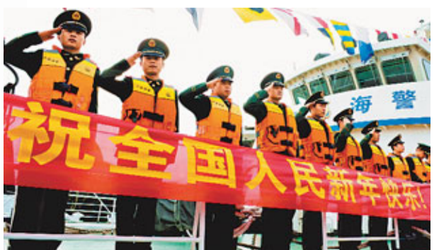
福建海警一支隊官兵31日在駐地巡邏艇上舉行迎新年活動。新華社

新華社北京31日電 2012年1月1日出版的新年第1期《求是》雜誌，將發表中共中央總書記、國家主席、中央軍委主席胡錦濤的重要文章：《堅定不移走中國特色社會主義文化發展道路，努力建設社會主義文化強國》。