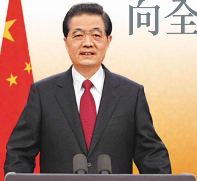
國家主席胡錦濤在新年前夕發表題為《共同促進世界和平與發展》的新年賀詞。

香港文匯報訊 國際線上報道，中國國家主席胡錦濤12月31日發表新年賀詞表示，在新的一年里，將繼續處理好保持經濟平穩較快發展、調整經濟結構、管理通脹預期的關係，加快推進經濟發展方式轉變和經濟結構調整，着力保障和改善民生，努力鞏固經濟社會發展良好勢頭。