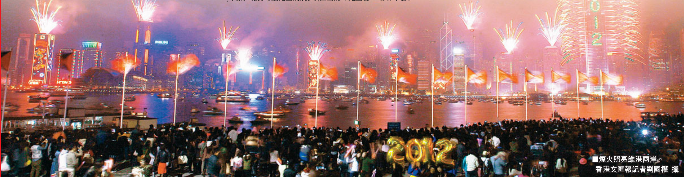
煙火照亮維港兩岸。

過往香港出生的「元旦寶寶」有男有女，有港人所生的寶寶，也有內地孕婦所生的寶寶。去年公立及私家醫院至少有4名嬰兒「搶閘」在零時出生，其中一名在伊利沙伯醫院出生男嬰更是踏正凌晨零時出世，父母親均為港人；2010年更厲害，共有8名「元旦寶寶」在凌晨零時後「搶閘」出世，其中首名「元旦寶寶」是內地孕婦所生，與第2名的「港產」元旦男嬰相差2分鐘。