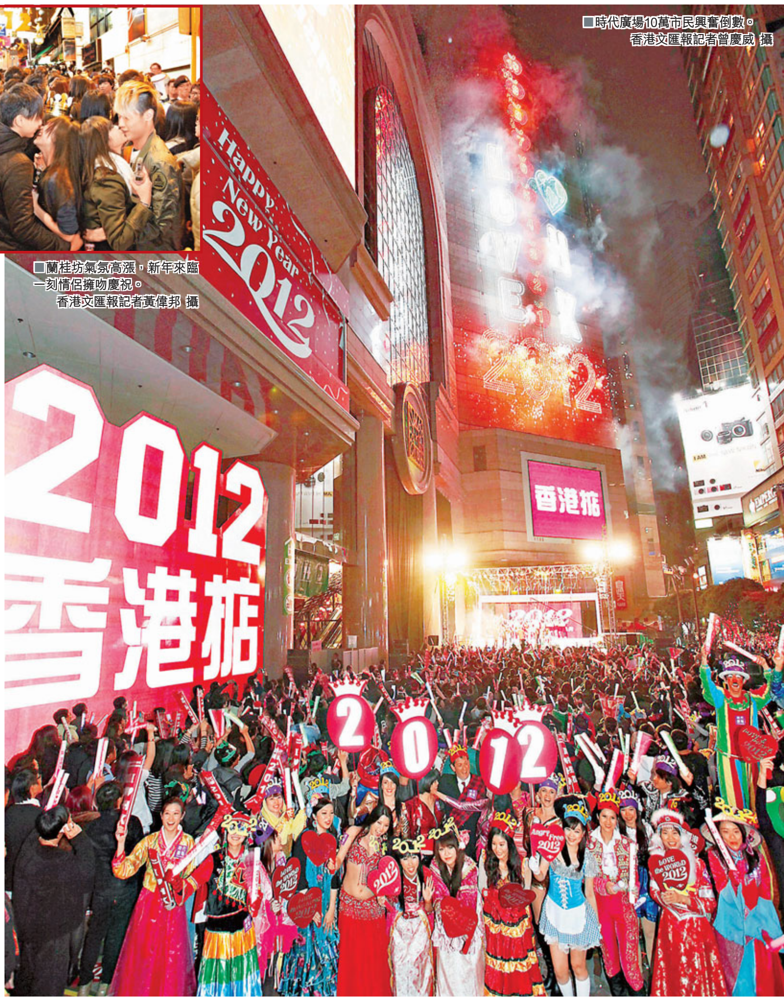
時代廣場10萬市民興奮倒數。