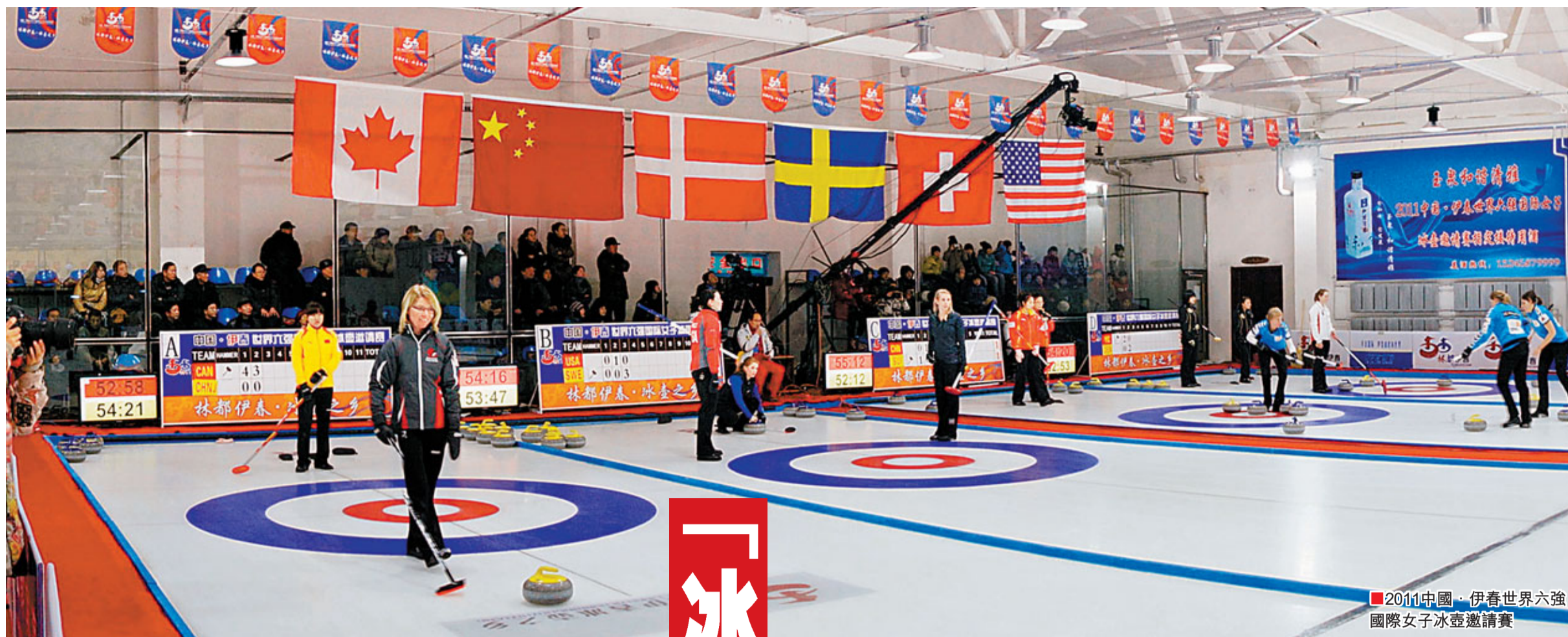
2011中國·伊春世界六強國際女子冰壺邀請賽

2011中國·伊春世界六強國際女子冰壺邀請賽於2011年12月16日上午10時在伊春市冰壺場館點燃戰火。來自瑞典、加拿大、丹麥、瑞士、美國和中國六個國家的八支隊伍輪番展示高超的冰壺技藝，上演了一場具有國際頂尖水平的冰壺爭霸戰。