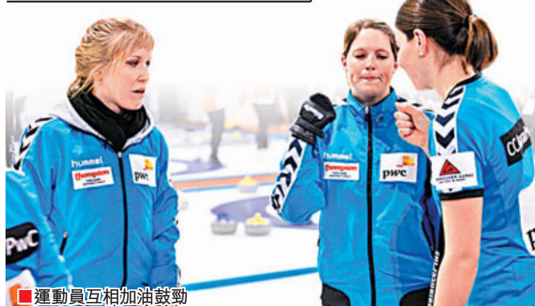
運動員互相加油鼓勁