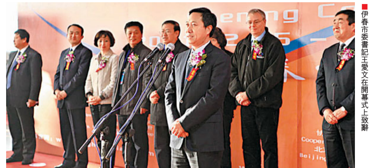
伊春市委書記王愛文在開幕式上致辭