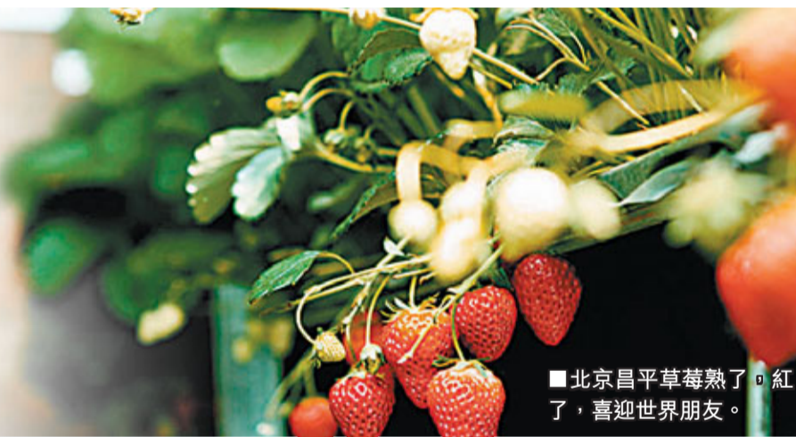
■北京昌平草莓熟了。紅了，喜迎世界朋友。