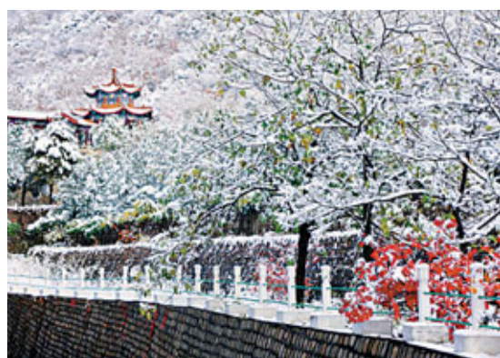
■昌平景區：雪中蟒山國家森林公園

昌平區作為北京市旅遊重地，位居郊區縣旅遊的龍頭地位，旅遊資源是該區三大支柱產業之一。產業結構形成了名勝古蹟、自然風光、現代娛樂、康復療養、休閒度假、知識博覽、民俗風情、觀光農業和溫泉會展九大旅遊系列產品體系。未來將統籌旅遊資源，優化旅遊環境，積極籌劃和推進一批大型綜合性旅遊項目，完善集「吃住行遊購娛」於一體的旅遊產業體系，更好地滿足不同層次的旅遊消費需求。抓住歷史機遇、推動轉型升級，走高端、創新、綠色、融合之路，促進全區旅遊產業走高端路線，一方面引進