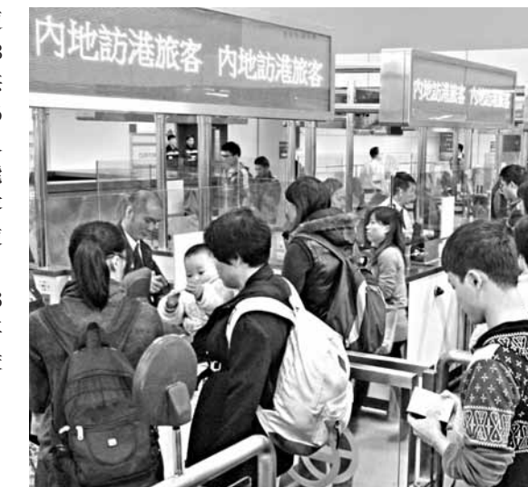
入境處工會表示，堵截內地孕婦人手不足，希望處方增員。資料圖片

入境處回應指，處方會繼續靈活調配人手，按實際需要及循「資源分配工作」程序申請增加人手，以及其他資源調配。