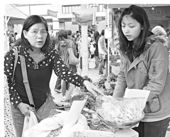
漁農美食迎春嘉年華場內多個攤位售賣本地出產有機漁農產品。香港文匯報記者 黃偉邦 攝

作員及雜工。周綺萍直指，比例偏高，「如果是2%至3%尚可接受，但6.6%太高。站在僱主立場，會質疑這些人工作能力發生甚麼問題，差不多一個月轉一次工，僱主對他們不會有信心，即使想找一份長工都難」。她估計，這批頻頻「跳槽」的打工仔，部分人專門做散工，或是自由業者，部分是被裁後無法重新適應新工作的中年人士，「這是職場中一個大問題，不斷轉工會令社會成本增加，亦浪費資源」。