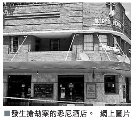
發生搶劫案的悉尼酒店。網上圖片