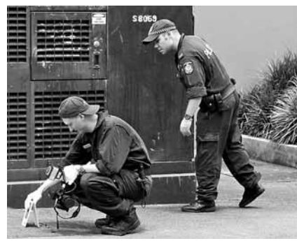
警方在中國領事館旁蒐證。

澳洲悉尼一家酒店昨日凌晨發生搶劫案，之後其中一名疑犯與警方展開追逐戰，倉皇逃下連轟數槍，更一度闖入中國駐悉尼總領事館。經6小時圍捕，當地警方在領館附近一幢建築內將疑犯緝拿歸案，當局感謝領事館大力協助。