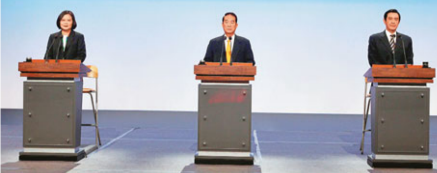
馬英九回應說，他從未指示安全單位針對在野黨的活動進行任何監控，蔡的指控是胡亂抹黑指控。馬英九亦不忘暗諷陳水扁，說自己不希望他的調查局長像前朝的調查局長一樣，在「總統」有洗錢嫌疑時，還跟「總統」通風報信。