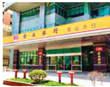
■彰化銀行昆山分行。資料圖片

香港文匯報訊 台北消息：台灣彰化銀行佈局大陸金融市場再下一城，台灣金管會29日宣佈，同意彰銀申請在大陸地區設立花橋支行。此為台灣銀行業在大陸設立的第一家支行。花橋位於江蘇省昆山市內。