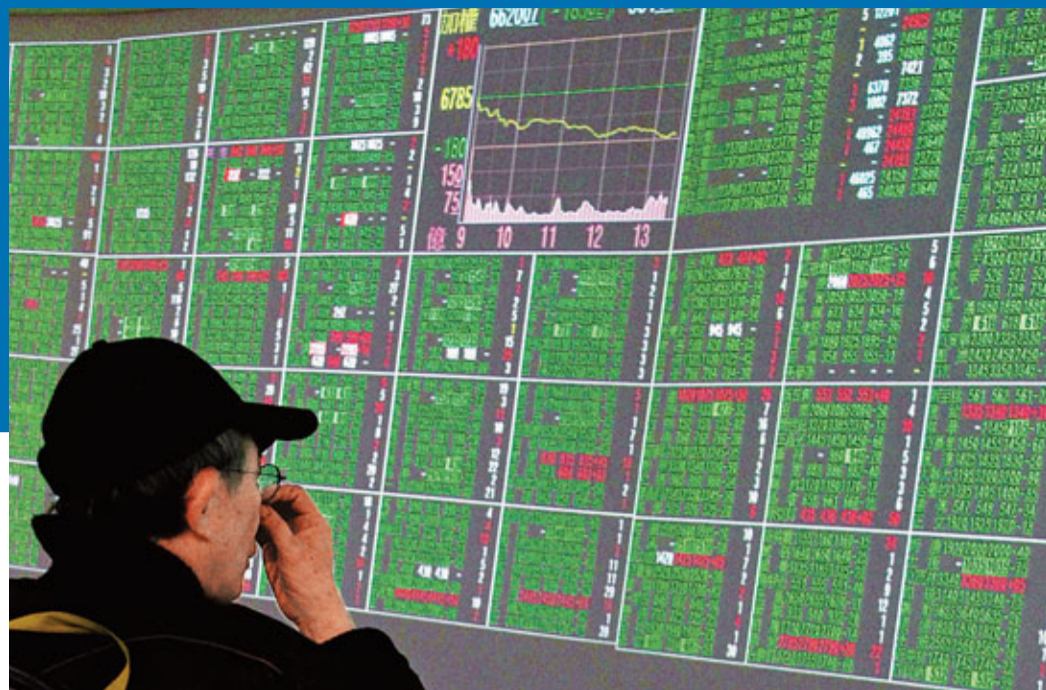
■2011年台灣股海翻波，股市蒸發超過4億新台幣。圖為台股民人均虧58萬的「一片慘綠」。

香港文匯報訊 綜合消息：12月30日是台灣股市2011年最後一個交易日，以7072.08點收市，較去年最後一個交易日收市點比較，台股今年高開低走，全年跌1900點，跌幅達21.18%。台灣證券交易所(證交所)同日統計發現，今年台股市值只剩19.2萬億元(新台幣，下同)，較去年同期銳減4.59萬億元，以有效開戶800萬戶計算，平均每個股民在2011年虧掉58萬元。