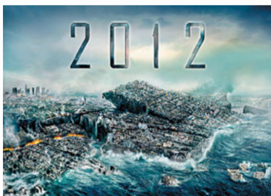
■ 電影《2012》以瑪雅預言作為故事背景，講述世界末日。