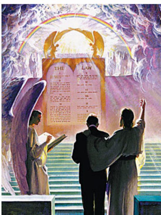
■ 從古至今，每隔一段時間便出現末日預言。