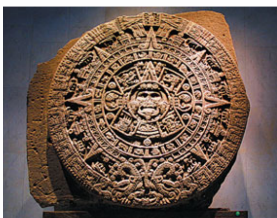
■ 記載瑪雅日曆的石碑。

單是今年便有兩次末日傳言，美國加州一位89歲傳教士預言2011年5月21日是世界末日的開端，世界各地將接連發生大災難，世界在10月21日結束。5月21日過了，10月21日也成為過去，世界完好無缺。這位傳教士已先後預言過1988年5月21日與1994年9月7日是世界末日，隨着2011年結束，他的預言被完全推翻。多次預言落空並沒有教人理智判斷事件，人們依然一窩蜂地追隨瑪雅曆法，篤信2012確是不一樣的一年。但世界末日當真存在嗎？