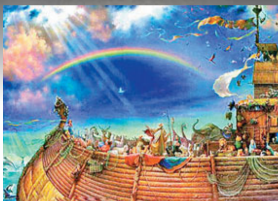
■ 聖經記載上帝讓挪亞製造方舟，度過洪水之災，末日時可不再有一艘方舟助人們度過厄運。

踏入20世紀，世界末日的預言愈來愈多。耶和華見證人預言世界將在1914年毀滅，預言雖然破產，但追隨者仍聲稱世界將在「不久後」走向終結。1919年，氣象學家亞伯特斯斷言行星會合形成的強大重力會使地球爆發，聽到這一預言後，有人害怕得自殺。有人針對聖經中提到的二次降臨，認為耶穌將在1999年7月7日降臨，並將這日視為世界末日。作家理查德在《冰：終極災難》一書中預言2000年5月5日是世界末日，融冰將湧向赤道，形成災難性的氣候變化，預言雖然落空，但科學家確實憂慮氣候暖化造成冰層融化。