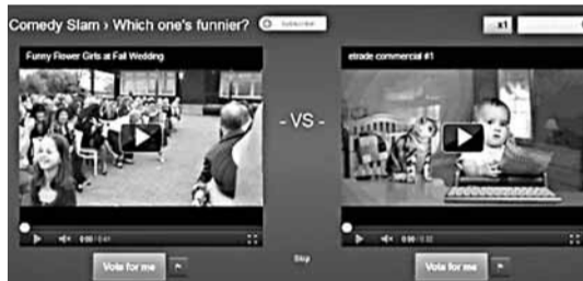
YouTube新服務Slam讓網民能票選心水影片。

新服務把短片分成5個類別，包括趣味、可愛、音樂、古怪及舞蹈，每周選出同類短片互相對戰，再由用戶投票選出心儀短片。用戶投票後可獲得「預測群眾喜好分數」，讓他們跟其他選民比較預測眼光，提供電視般的互動感覺。 ■《每日郵報》