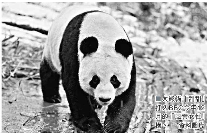
大熊貓「甜甜」打入BBC今年12月的「風雲女性」榜。資料圖片