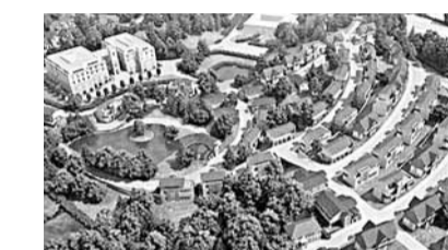
擬選址威爾斯西部蘭瓦尼德的度假村佔地22英畝，設有92張床位的豪華酒店及80間度假小屋，並建有大型停車場、泳池及商店。村內告示及路牌將同時使用中英文，於當地聘用的工作人員將通曉普通話及英語，熟習中國文化習俗，以令到訪遊客感到賓至如歸。

提起威爾斯，不少人可能只想起曼聯中場貝斯，對當地旅遊景點卻毫無頭緒。威爾斯有發展商正計劃斥資5,000萬英鎊(約6億港元)，於西部郊區興建大型度假村(見圖)，並培訓工作人員學習中國文化習俗，以吸引中國及遠東旅客前往消費。