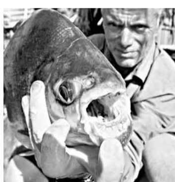
當地2名漁民因睾丸被牙齒鋒利的鋸腹脂鯉咬掉，失血致死。

南太平洋島國巴布亞新幾內亞近日驚傳民眾在湖裡被魚咬掉睾丸，最後因失血過多致死的慘劇。據調查，這些殺人兇手是食人魚的近親鋸腹脂鯉(Pacu fish)，被人從巴西引進後棄養，在當地被稱為「切蛋魚」(Ball Cutter)。