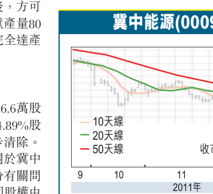
冀中能源(000937.SZ) 收市：16.32元人民幣