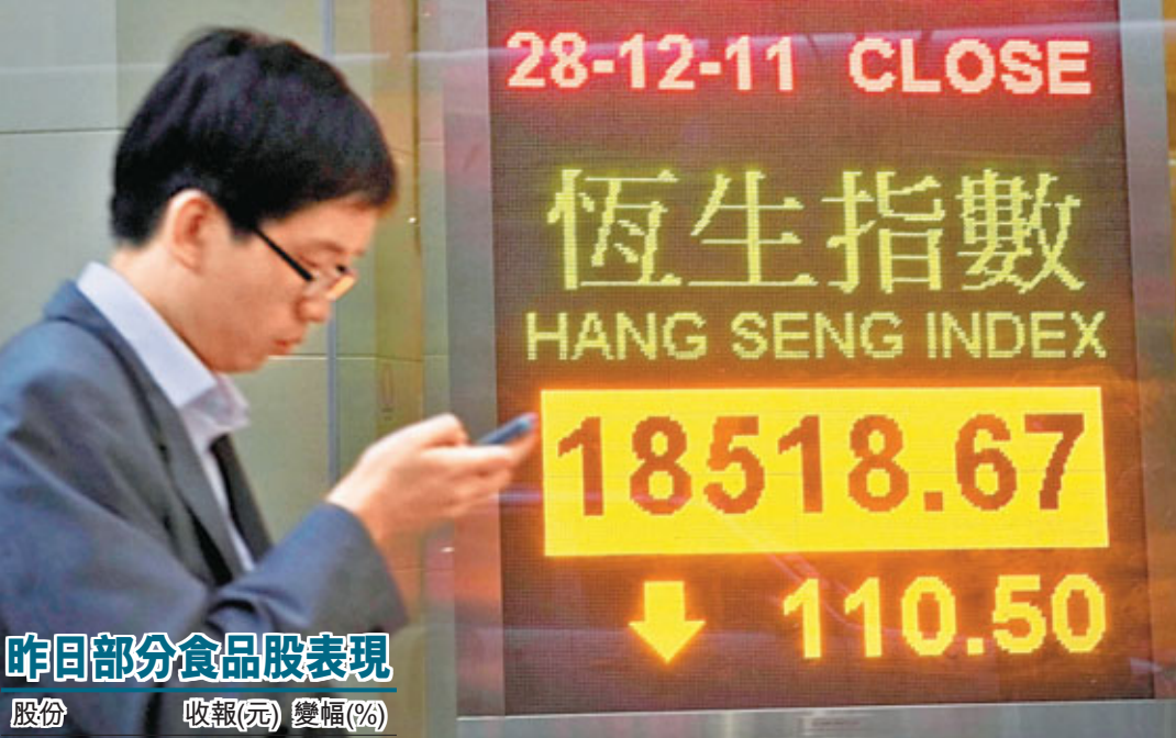
昨日部分食品股表現