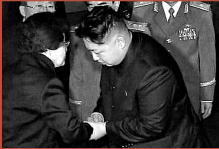
■李姬鎬(左)弔唁後與金正恩(右)握手。