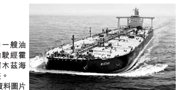
■一艘油輪駛經霍爾木茲海峽。

伊朗官方通訊社昨日引述副總統拉希米指，假如西方制裁伊朗石油出口，伊朗將「不容許一滴石油」通過霍爾木茲海峽。這番言論反映伊朗已準備好一旦面對西方制裁或攻擊時，將封鎖這條佔全球超過1/3的海上石油運輸路線。 拉希米表示，伊方無意尋求敵對或暴力，但由於西方一意孤行實施制裁，伊朗唯有作出反擊，迫使敵人讓步。目前伊朗海軍正在霍爾木茲海峽進行大規模軍演，昨日有艦船及戰機演習在海裡投擲水雷。 同樣面對西方壓力的敘利亞，首批赴敘國的阿拉伯聯