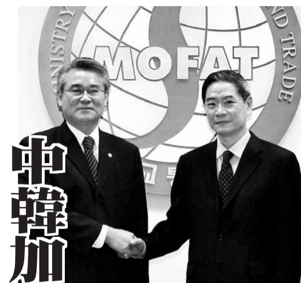
■中國外交部常務副部長張志軍(右)與韓國外交部商部第一次官朴錫煥(左)在會上握手合照。

提名為接班人後，即接受「接班培訓」，去年9月當選中央軍委副委員長等要職，「4巨頭」亦在前後時間成為金正恩親信。 掌控逾5萬衛戍部成員的禹東測，2009年4月在最高人民會議當選國防委員會委員，是首位衛戍部出身的委員。李明秀曾任總參謀部作戰局局長，2009年初開始負責培訓金正恩接班的工作，目前指揮保安部逾23萬人。保安部及保安部現時由國防委員會副委員長張成澤全權負責。 ■韓國《朝鮮日報》