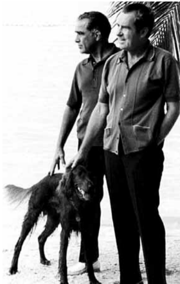
■尼克松(右)與同性好友雷博佐(左)關係非比尋常。

1970年代轟動一時的「水門事件」，導致時任總統尼克松於任內黯然辭職。華盛頓資深記者富爾森下月推出新作《尼克松黑暗秘史》，大爆尼克松1969年上任時已嚴重酗酒，甚至經常虐妻。作者聲稱尼克松跟有黑手黨背景的同性「摯友」雷博佐有不尋常親密關係，較水門事件更耐人尋味。 富爾森綜合近期公開的文件，以及訪問包括聯邦調查局(FBI)探員在內的人士，得出尼克松與雷博佐間的「超友誼」關係。富爾森指出，尼克松與妻子帕特在人前只是表面恩愛，私下卻大罵她是「妓女」，更長期虐妻。兩人在白宮長期分房睡，到訪邁阿密別墅時，帕特甚至拒絕跟丈夫同處一座建築物，