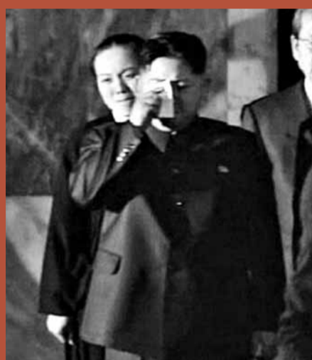
■金正恩出席弔唁儀式時神情哀傷(右圖)，不禁拭淚(左圖)。

朝鮮今日將為已故前領袖金正日舉行殯禮告別儀式，但當局至今尚未公布各項詳情，只確定儀式不會邀請外國唱團參加。西方傳媒相信，葬禮將與1994年其父金日成的相似，但當中可能加添「金正日元素」，例如展示武器以強調「先軍政治」等思想，外界亦關注儀式上官員列序，藉以一窺金正恩時代的權力安排。