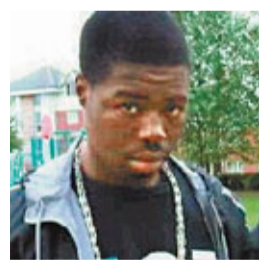
■遇襲身亡的黑人青年。

英國倫敦在「拆禮物日」瘋狂搶購的同時,繁忙商業街牛津街則在數小時內連續發生兩宗命案,導致兩名青年一死一傷,部分商店被迫關門。警方拘捕10多人盤問,懷疑事件涉及黑幫糾紛,亦可能是因搶購波鞋引起爭執。