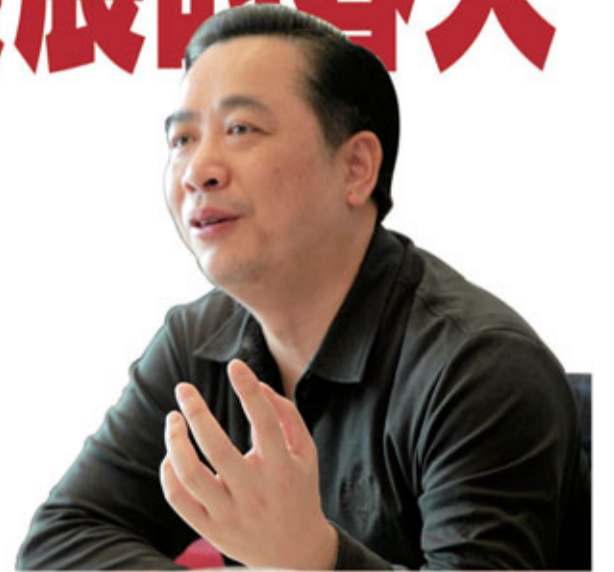
■廣東海洋與漁業局局長鄭偉儀

「作為海洋人,我們深知促進區域協調發展是加快轉型升級、建設幸福廣東的重大任務。所以我們將按照海陸統籌、優勢集束、聯動發展的原則,着力建設海洋經濟珠三角優化發展區和粵東、粵西重點發展區。」