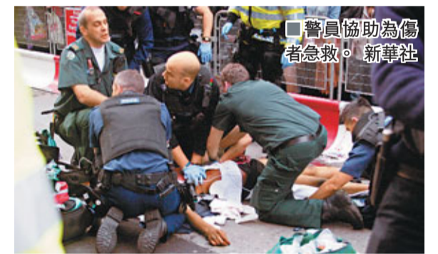
■警員協助為傷者急救。