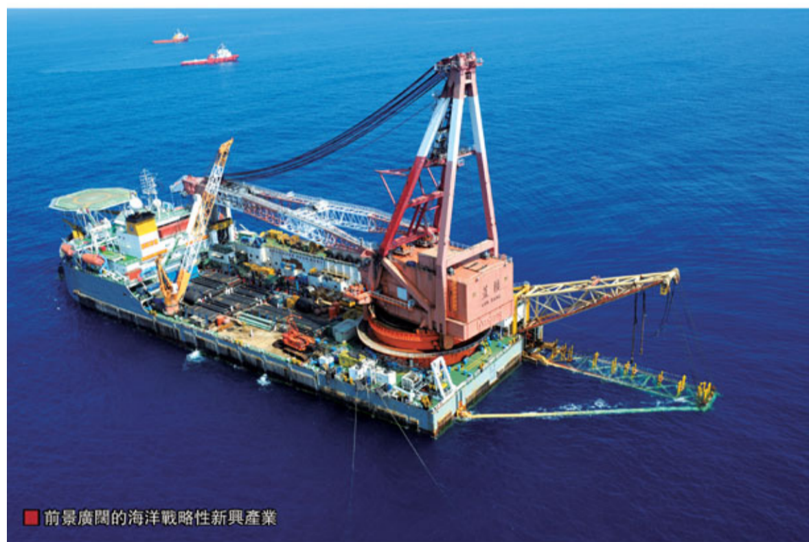
■前景廣闊的海洋戰略新興產業