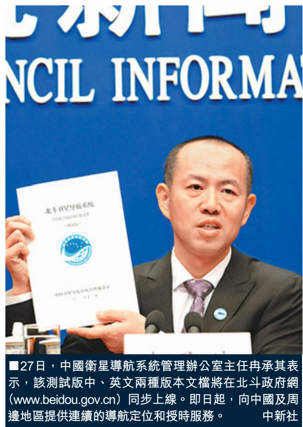
■27日，中國衛星導航系統管理辦公室主任冉承其表示，該測試版中、英文兩種版本文檔將在北斗政府網(www.beidou.gov.cn)同步上線。即日起，向中國及周邊地區提供連續的導航定位和授時服務。中新社

香港文匯報訊(記者 劉凝哲 北京報道)中國衛星導航系統管理辦公室主任冉承其昨日宣佈，擁有10顆北斗衛星的中國導航系統已基本建成，開始向中國及周邊地區提供連續的導航定位和授時服務。目前北斗導航系統已覆蓋包括港澳在內的亞太大部分地區，前期測試顯示，系統運行穩定、具備很高的精度，「香港和澳門的用戶，使用北斗是非常容易的事情」。北斗系統向全球提供免費導航服務，港人可免費使用導航信號。