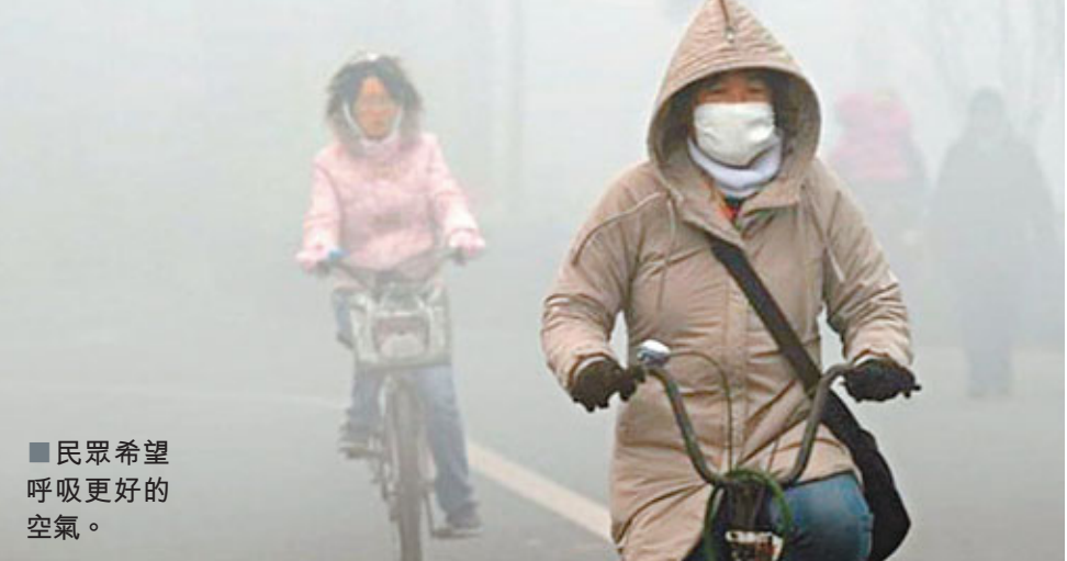
■民眾希望呼吸更好的空氣。

香港文匯報訊(記者 古寧 廣州報道)廣東省委書記汪洋27日出席廣東省環境保護工作會議時表示，廣東要緊抓做好增加PM2.5監測指標的準備，並在珠三角率先將PM2.5納入空氣質量評價體系。