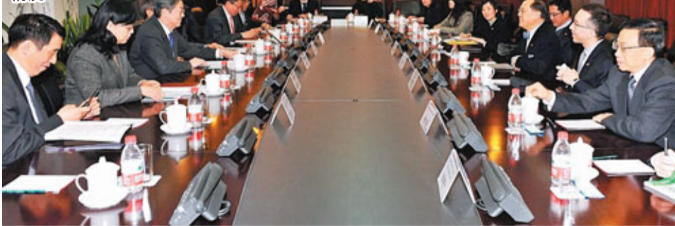
行政長官曾蔭權與周小川會面情況。

曾蔭權昨日繼續訪京述職第三日行程，下午分別拜訪發改委及人民銀行，討論進一步加強內地與香港的財金合作。會上，曾蔭權強調，去年「十二五」規劃將香港作為獨立專章，是香港經濟發展的里程碑，既能在國家發展過程中做出貢獻，同時拓大香港本身的發展空間，也提出了區域發展中，香港將來的整體發展步伐，理順本港和內地分工，「尤其是珠江三角洲的分工，由香港擔任金融業龍頭角色，特別感謝發改委支持香港發展」。