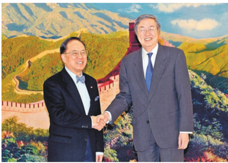
曾蔭權昨與中國人民銀行行長周小川會面。

香港文匯報訊（記者 黃斯昕 北京報道）明年即將卸任的行政長官曾蔭權最後一次到北京述職，昨日繼續馬不停蹄先後拜訪國家發改委主任張平及人民銀行行長周小川，主要就國務院副總理李克強訪港宣布「36項中央惠港措施」的落實，以至前海發展交換意見。張平強調，發改委就曾蔭權去年提出的合作問題都得到貫徹落實，取得重要進展，包括國家「十二五」規劃中香港的定位；如何在區域中發揮香港特殊的優勢和作用；以及前海發展項目進展順利，發改委和各個部門會繼續按照中央的要求與香港發展的需要，做好工作配合。