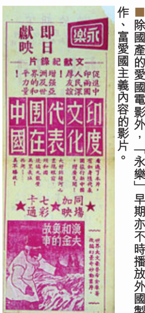
除國產的愛國電影外，「永樂」早期亦不時播放外國製作、富愛國主義內容的影片。

「永樂大戲院」除了放映時下新潮的中西影片外，最吸引澳門本地市民的，莫過於經常舉辦粵曲、話劇、雜技、魔術等等豐富多彩的演出，吸引了大量的「票友」和「粉絲」趨之若鶩，樂此不疲。繁忙時期，在「永樂」登台唱戲，要提前很久預約租場。自70年代起，「永樂」戲院擴充及增加了舞台設施後，本地及內地的表演團體在永樂的舞台上演出無數精彩節目，為觀眾們帶來不少歡笑與娛樂。這種市民喜聞樂見、自娛自樂的文化娛樂形式也成就了「永樂大戲院」創辦60年歷史的澳門優秀品牌。蘇經理指，「永樂」未來將繼續強化服務，配合時代發展而推陳出新，他說：「戲院往後亦將繼續兵分兩路，一方面繼續為觀眾播放有質素的影片，另一方面亦會繼續把場地租借予表演團體作舞台演出，作為各社團開展活動的主場地，以彰顯社區戲院的功能與角色，繼續為廣大市民提供優質的娛樂及服務。」