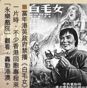
當年港英政府禁播《白毛女》一片時，不少香港同胞專程來「永樂戲院」觀看，轟動港澳。