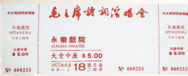
早在70年代，戲院已把舞台租借予社團演出之用，如77年便曾在此上演過歌頌毛澤東的《毛主席詩詞演唱會》。

「永樂大戲院」是澳門現存歷史最悠久的戲院，創辦以來，放映了許多優秀的國產電影，因而名聲大噪，甚至吸引了眾多香港觀眾專程到來觀看。而1952年到2010年，永樂戲院每年都會舉行中華人民共和國國慶的慶祝大會。「永樂大戲院」不僅僅是市民消閒娛樂的場所，背後還有着更深層次的意義，那就是藉此作為宣揚愛國主義的教育基地。