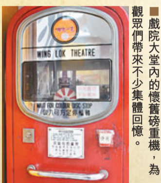
戲院大堂內的懷舊磅重機，為觀眾們帶來不少集體回憶。

「永樂大戲院」以中國傳統書法題寫，取其「永遠快樂」之意，為觀眾提供豐富多彩的娛樂節目。