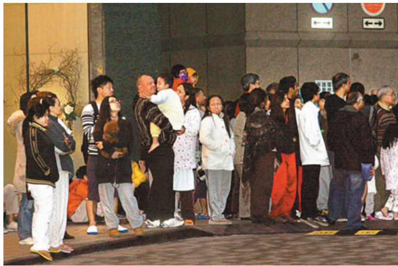
大批住客被疏散到樓下暫避，部分人僅穿睡衣拖鞋，十分狼狽。

消防員於清晨6時37分終將火救熄，惟肇事單位已嚴重焚毀。經調查相信是廳中一部傳真機短路起火，再