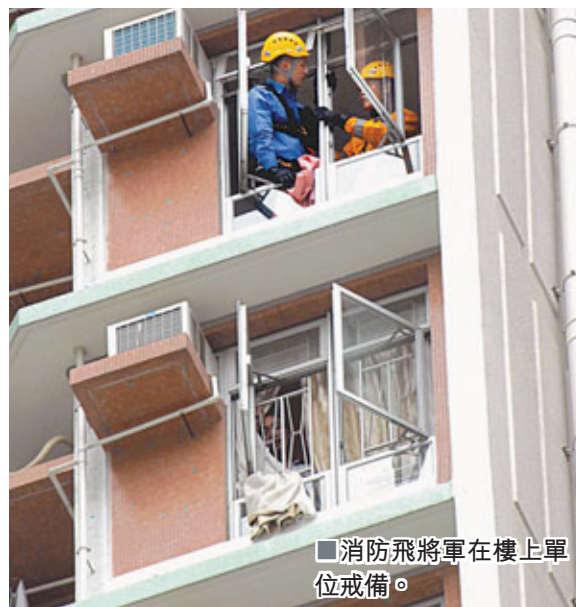
消防飛將軍在樓上單位戒備。