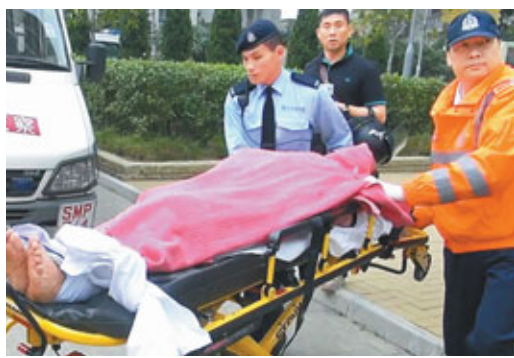
越籍漢被制服拘捕，五花大綁送院。

警員事後在屋內並無發現任何毒品，亦沒有找到傷害女事主的生果刀，不排除已被人丟棄，事件暫列作傷人案處理。