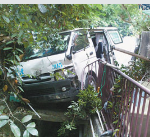
失事客貨車險撞村屋最後剝落側邊明渠。

長和集團強調，該集團絕不會以賄賂手法去取得政府批准；除即時否認《財經》文章的內容外，長實與黃分別入稟法院控告《財經》侵權。對是次獲判勝訴，集團發言人說：「我們歡迎法院的判決。」