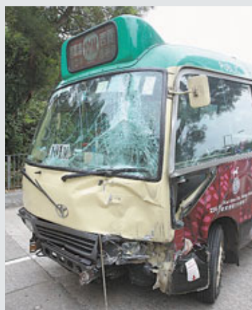
失事的其中一輛專線小巴車頭毀爛。

香港文匯報訊(記者 杜法祖)西貢公路近匡湖居昨晨發生3輛小巴連環相撞意外，一輛專線小巴疑減速準備停車上落客時，未料卻導致緊隨其後一輛專線小巴及一輛公共小巴收掣不及，釀成3車「串燒」，分告車頭及尾部撞毀，意外中1名司機和5名男女乘客受傷送院，幸各人傷勢均不嚴重，惟受事件影響，現場交通一度十分擠塞。