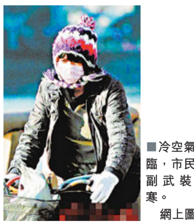
冷空氣降臨，市民全副武裝禦寒。網上圖片

通知強調，各地、各部門要抓好近期特別是元旦、春節期間的各項防火安全工作。要立即組織開展防火工作檢查和火險隱患大排查。強化群眾生活用電、用氣、用火管理，加大對公眾聚集場所消防安全防控工作，加強對風景名勝區、森林公園等人口密集區域的巡查，切實防範重、特大火災以及群死群傷事件發生。