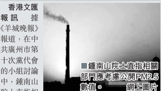
香港文匯報訊 據《羊城晚報》報道，在中共廣州市第十次黨代會的小組討論中，鍾南山院士直指相關部門應考慮公開PM2.5數值。

「報告以幸福廣州為主題，幸福看什麼？環境怎麼樣？肯定要看你的空氣好不好，水好不好，看你的食物安不安全，藥假不假。」在報告提到的「八大工程」中，鍾南山院士更關注生態環保工程，尤其是「空氣環境、水環境的綜合整治」。鍾南山院士發言表示：「現在，有的部門談起生態，總是扭扭捏捏。那麼廣州敢不敢報？你報了以後，超標就超標嘛！我們大家一起努力嘛。」