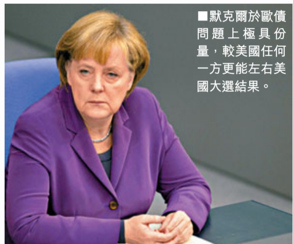
默克爾於歐債問題上極具份量,較美國任何一方更能左右美國大選結果。

香港文匯報訊(記者 邱家威、張易)若說2011年是「示威年」,那麼2012年肯定是「選舉年」。明年全球約有50個國家及地區舉行國會及領導人選舉,包括俄羅斯、法國、美國及韓國等主要經濟體,當中以美國大選最為矚目。到底美國總統奧巴馬能否延續2008年的「奇蹟」?還是共和黨捲土重來?勢必是2012年全球焦點。