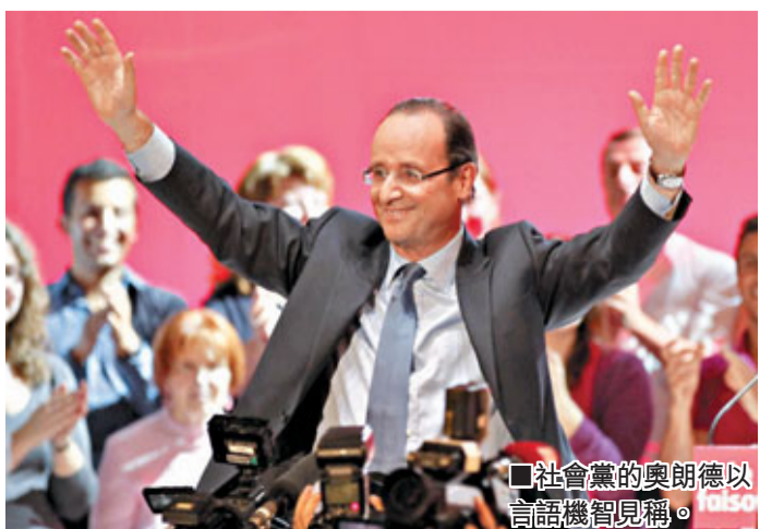
社會黨的奧朗德以言語機智見稱。