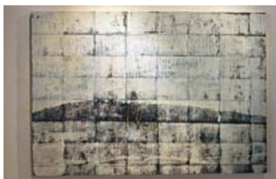
■空間之間的不確定性