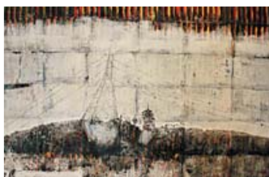
■變換焦點，探索虛擬和真實

Google Map是這樣一種大家都可見的、有熟悉感的事物，但他所使用的再創作方式卻很少見。「我喜歡將作品放到大幅，也喜歡用絲網不斷複印。」他形容絲網是mechanical的，機械冰冷，感情相對比油畫水彩都要淡。「但Google Map本身就是電腦捕捉成像，本身就帶有一種機械的冷。」又因為使用菲林，因而這些作品某種程度上幾乎可以用絲網直接對應google街景的效果，按江耀榮的話說，即「好像是真實風景中的註腳」——由藝術家作出的註腳。絲網的特點是從照片直接轉出成像，於是便有了《連綿》中的奇妙效果，從照片中轉化、組合、再改動，將相片中一些原本單一的事物不斷重複，打散視點，「由單點透視變為多點透視，創造不同的視