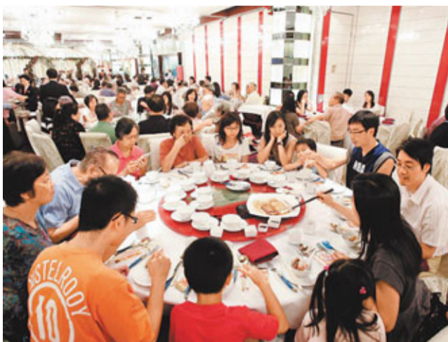
業界人士指出,飲食業好景背後存在諸多隱憂,包括業主加租、兩電加價、食材及工資上漲。圖為市民於節日在酒樓用膳。

黃家和指出,最近有位於旺區的小型食肆與業主洽商續租時,被業主加租50%,「餐飲業經營成本當中,40%用於食材,租金及工資各佔25%,扣除其他經營成本,純利只有2%至3%,任何一項成本增加,都會直接影響利潤」。他又直言,明年7%電費加幅亦加重食肆的經營壓力,「稍為大型的店舖一個月交20萬元電費,加價後就要多交1萬多元」。