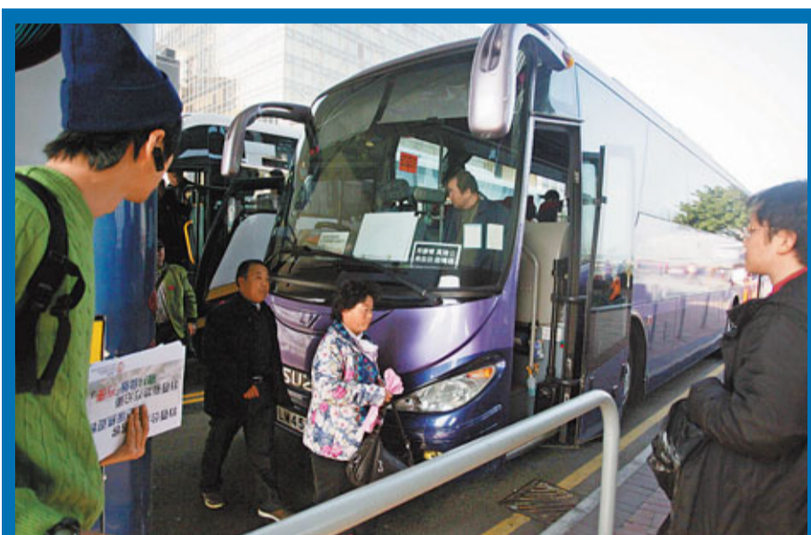
由於泊車位嚴重不足,星光大道附近出現「雙線泊車」等阻礙交通情況。

運輸署回應指,早前已在金馬倫道加設兩個路邊巴士咪錶泊車位應付需要。警方回應指,由於預計昨日仍會有大批市民前往尖沙咀區慶祝聖誕節,故一如以往,因應人流情況實施封路措施,區內部分咪錶泊車位暫停使用。該措施直至今日凌晨3時,以確保交通暢順及保障道路使用者安全。警方會在有需要時檢討有關安排,減低對公眾人士帶來的不便。除夕期間,警方會採取適當行動,保持交通暢順。