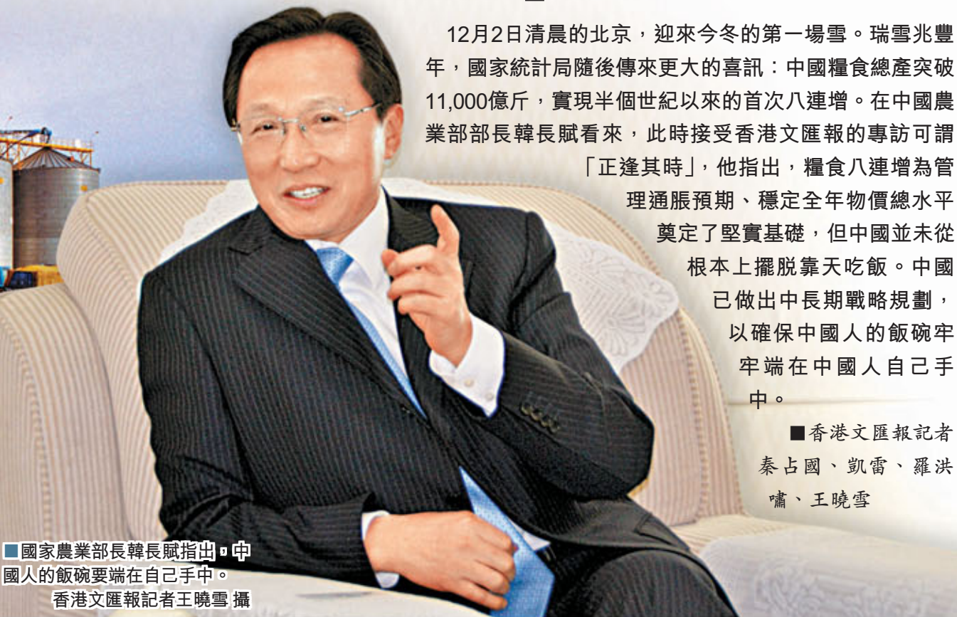
國家農業部長韓長賦指出，中國人的飯碗要端在自己手中。

12月2日清晨的北京，迎來今冬的第一場雪。瑞雪兆豐年，國家統計局隨後傳來更大的喜訊：中國糧食總產突破11,000億斤，實現半個世紀以來的首次八連增。在中國農業部部長韓長賦看來，此時接受香港文匯報的專訪可謂「正逢其時」，他指出，糧食八連增為管理通脹預期、穩定全年物價總水平奠定了堅實基礎，但中國並未從根本上擺脫靠天吃飯。中國已做出中長期戰略規劃，以確保中國人的飯碗牢牢端在中國人自己手中。