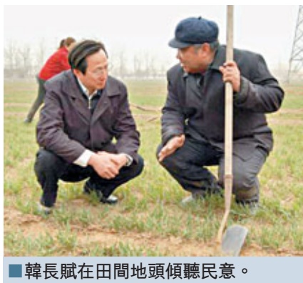
韓長賦在田間地頭傾聽民意。