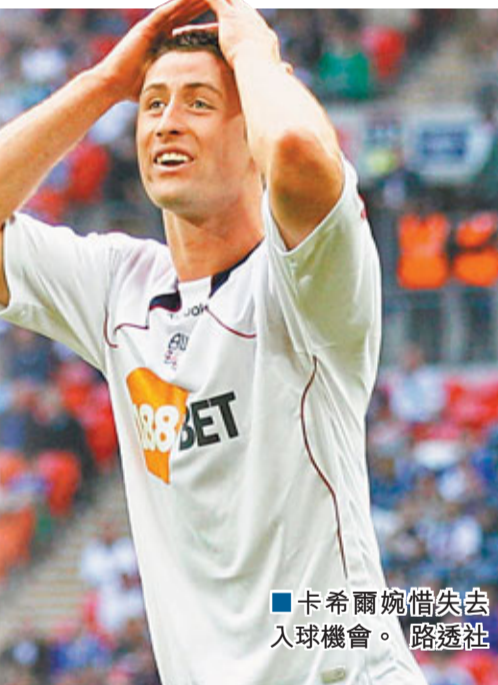
■卡希爾惋惜失去入球機會。

卡希爾在2008年一月份以500萬英鎊從維拉加盟保頓，如今他已經是英格蘭隊的一員，不過由於合同即將到期的關係，英國媒體披露車路士對他的收購價大約在700萬英鎊左右。與此同時，車路士主教練保阿斯正式確認，藍軍將在二月份轉會窗口開啟後簽下一名新的中後衛。據《每日鏡報》披露，熱刺在最後階段加入了對卡希爾的爭奪，但卻為時已晚，該報稱，車路士即將以700萬英鎊簽下英格蘭國腳，藍軍已經對卡希爾關注了四個月，並且較早開始了行動，他們看起來肯定會擊敗熱刺，得到心儀的目標。《每日鏡報》稱，在與紐卡素和狼隊的聖誕賽後，卡希爾就將在二月初轉投車路士，而保頓希望以200萬英鎊簽下紐約紅牛隊的中後衛里姆來頂替英格蘭人的位置。 ■綜合外電