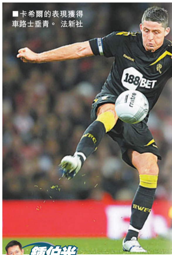
■卡希爾的表現獲得車路士垂青。