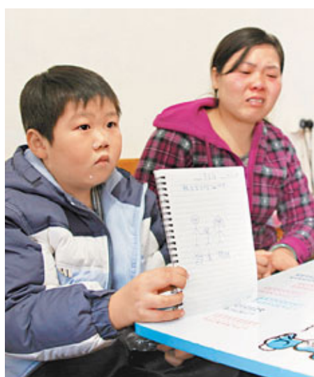
家僑的心意畫作已永遠不能親手交給爸爸。