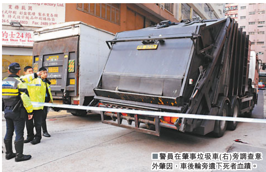
警員在肇事垃圾車(右)旁調查意外原因，車後輪旁遺下死者血蹟。