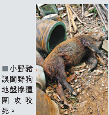
小野豬誤闖野狗地盤慘遭圍攻咬死。

香港文匯報訊(記者 杜法祖)將軍澳馬油塘村揭發豬狗大戰，一頭身長約2呎的小野豬，昨晨7時許被馬油塘村村民發現遍體鱗傷，倒斃山邊草叢，附近血跡斑斑，並有多頭野狗徘徊，相信小野豬早前曾遭野狗襲擊咬傷，於是報警求助。警員到場證實野豬已明顯死亡，為免豬屍成為野狗的聖誕大餐，遂