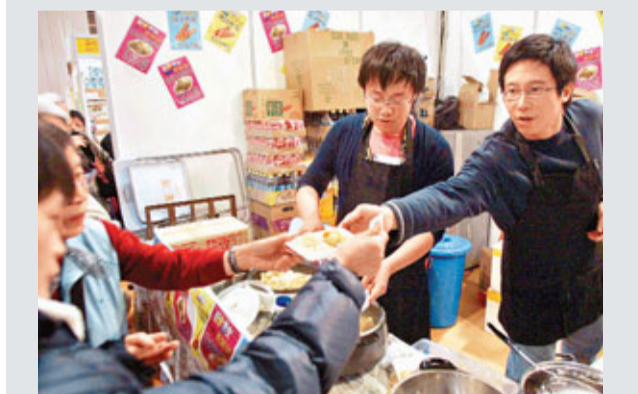
「好食男女」的檔主是4名80後，合資數十萬元經營小食檔，以大份的免費試食打響名堂。