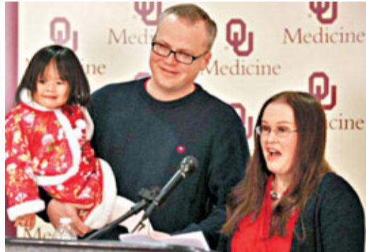
美國魯特夫婦在領養網站上看到梅斯後一見鍾情，立即領養她。