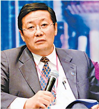
■市傳中投短期內可獲約500億美元外匯注資，圖為董事長樓繼偉。

香港文匯報訊（記者 趙建強）綜合外電消息，中國主權財富基金中國投資公司向中央政府申請的再注資有望成行，料中投短期內可獲約500億美元外匯注資，為其海外投資籌集新一輪