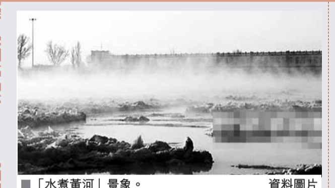
「水煮黃河」景象。資料圖片

香港文匯報訊(記者何斌、呼浩特)20日早晨，內蒙古磴口黃河三盛公水利樞紐段出現「水煮黃河」景象。據悉，「水煮黃河」奇觀當天早晨7點30分開始，黃河像煮餃子開了鍋，霧氣騰騰，蔚為壯觀，持續了1個半小時於9點結束。這樣的景象是在特殊的水溫和氣溫條件下出現的，不是每年都會出現，一般3至4年才能看到一次。