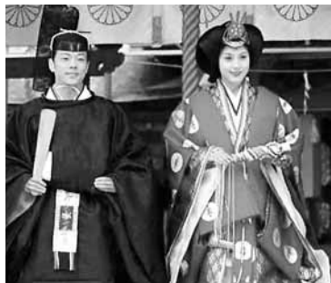
資料顯示，中日通婚離婚率較高，但是也有夫婦能夠共同努力，超越了語言與文化的不同。圖為日本傳統婚禮。

一位日本妻子說：我非常感謝我丈夫，他教會了我解決夫妻矛盾的辦法。夫妻間吵架，本來難分對錯，也不會有人來給你們裁判，而要把愛情進行到底，要得到家庭的和睦，最好的辦法就是互相勇於道歉，這是我丈夫用行動教給我的生活的藝術。