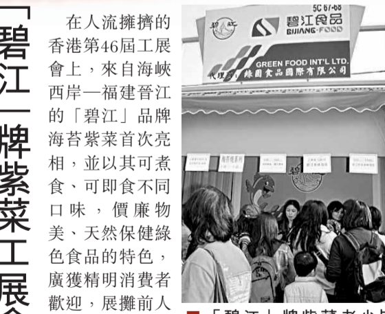
「碧江」牌紫菜老少皆宜，工展會上大受歡迎。

在人流擁擠的香港第46屆工展會上，來自海峽西岸福建晉江的「碧江」牌紫菜首次亮相，並以其可煮食、可即食不同口味，價廉物美、天然保健綠色食品的特色，廣獲精明消費者歡迎，展攤前人流不斷。一位主婦明確表示，因家裡人喜歡，故再次回頭購買。