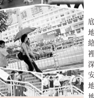
媒體按「十大熱點」巡察，僅遇一起扒竊案。

近日，一篇名為《年底了，深圳最容易被偷地點一覽》的帖子在網絡上被大量轉載，帖子裡列出了深圳火車站、深大西門桂廟一帶、寶安區交通局附近等10個地點(見表)，稱上述地點最容易被偷，提醒網友注意。