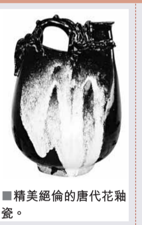
精美絕倫的唐代花釉瓷。

香港文匯報訊(記者周小舟、見習記者陳靜平)平頂山報訊)河南省科技攻關項目「唐代花釉瓷復仿製作技術研究」，日前通過河南省科技廳組織的專家鑒定。「唐代花釉瓷製作技術」恢復了失傳千年的唐代花釉瓷製作技術，繼承了優秀的中華文化。