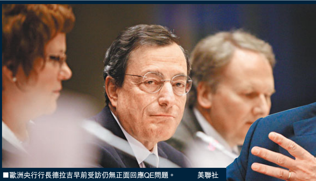
■歐洲央行行長德拉吉早前受訪仍無正面回應QE問題。