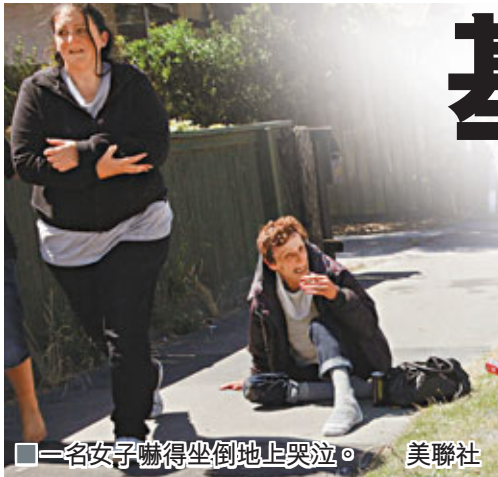
■一名女子嚇得坐倒地上哭泣。

新西蘭基督城昨日先後發生黎克特制5.8級及5.9級地震，是15個月內第3次強烈地震。今次地震造成60人傷，幸無人死亡，事發時很多居民正在商場搜購聖誕禮物，眾人爭相走避。有專家稱未來4年內，基督城仍會持續有地震，這將嚴重影響重建及日常生活，有經濟師更估計將有1/10居民移居他處；基督城副市長巴頓表示，新一輪地震可能令更多人考慮搬走，