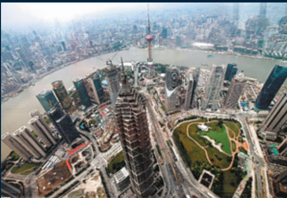
■惠譽稱中印的通脹及貨幣緊縮措施對投資構成壓力，故下調其增長預測。資料圖片

國際評級機構惠譽昨日表示，由於全球經濟疲弱，亞洲明年經濟增長預期由7.4%調低至6.8%，今年則為7.1%。另一評級機構穆迪前日宣布，將斯洛文尼亞主權信貸評級下調1級至「A1」，關注該國銀行業受債務拖累，對政府資產負債狀況構成風險，可能需要政府援助。