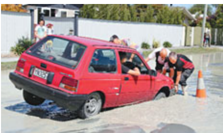
■馬路液化，有汽車陷於泥潭中。美聯社

去年9月，基督城發生7級大地震，由於事發在凌晨，街上人不多，傷亡不算嚴重；但在今年2月的6.3級地震中，有181人死亡，大量建築物倒塌，死者包括多名華人。 ■法新社/美聯社/路透社/《每日郵報》