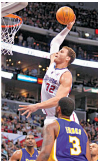
格里芬表演入樽。

在缺少高比拜仁下，湖人周三在第2場「洛市打吡」中，以103:108再負快艇，季前賽2戰皆北。快艇球星格里芬是役攻進全場最高的30分，當中在最後一節尚餘5分18秒時，個人獨取9分，成為球隊贏波關鍵，新加盟的基斯保羅貢獻7分和10次助攻，而卡朗畢拿和後備後衛威爾遜則各有16分進帳。