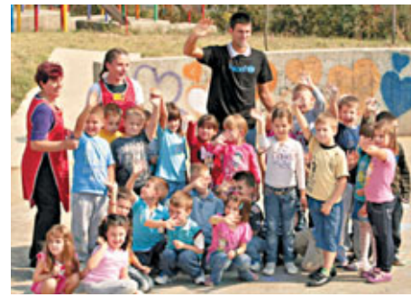
祖高域愛心爆棚。

另外，應屆國際網聯年度冠軍男球手、世界第一哥祖高域今年在賽場上賺取1261萬美元比賽獎金，但也不忘關愛社會。身為聯合國兒童基金會親善大使的祖高域，日前宣布捐獻10萬美元，協助祖國塞爾維亞兒童的早期教育。祖高域說：「希望我的捐助可以幫助整個塞爾維亞的孩子們，讓他們有一個更好的受教育環境，尤其是幫助那些有潛力的孩子，盡早發掘出他們的天賦。」