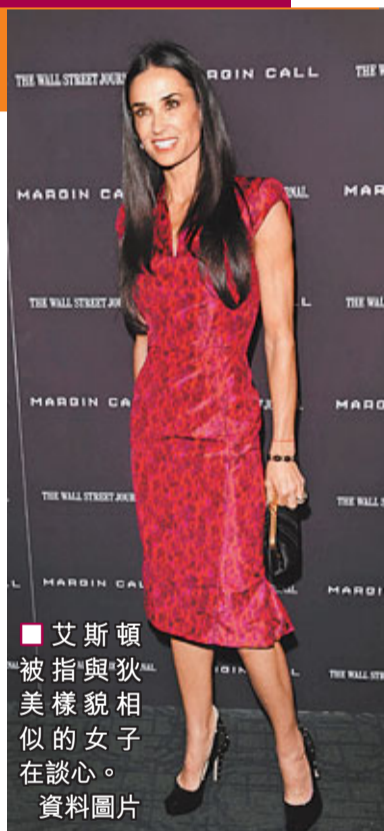
艾斯頓被指與狄美樣貌相似的女子在談心。