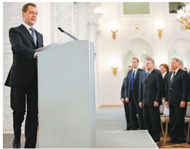
梅德韋傑夫在克里姆林宮發表任內最後一次國情咨文。

俄羅斯總統梅德韋傑夫昨日發表任內最後一次國情咨文，承諾卸任前推行一系列政治改革，包括恢復普選時廢除的州長選舉，期望所有民眾可合法參與政治活動，試圖平息反選舉舞弊引起的民怨。他同時宣稱，俄羅斯成為世界第6大經濟體。 梅德韋傑夫提出建立各地行政官員直選制度、簡化政黨註冊手續等，建議總統參選人的民眾聯署提名門檻，由現時200萬人降低至30萬，若非由議會政黨推舉的參選人則需10萬人提名。同時，為加強議員與選民間的聯繫，讓各區有代表直接進入議會，他建議在全國225個選區按比例推選議員。梅氏亦承諾放寬廣播限制，稱其中1家國營電視台可不受政府