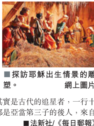
探訪耶穌出生情景的雕塑。網上圖片

聖誕節除了紀念耶穌誕生，以及有聖誕老人派禮物外，還有3名重要人物。根據聖經記載，耶穌出生時，有3位智者從東方跟隨星光來到耶穌出生地，但有寫自8世紀的古籍揭露原來智者不止3人，最遠的可能來自中國，為聖誕節加添一份中國風。 古籍《東方三博士揭秘》所指探訪耶穌出生的「東方三博士」其實是古代的追星者，一行十多人，可藉星象預測命運。他們都是亞當第三子的後人，來自世界最東邊，亦即現今的中國。 ■法新社/《每日郵報》