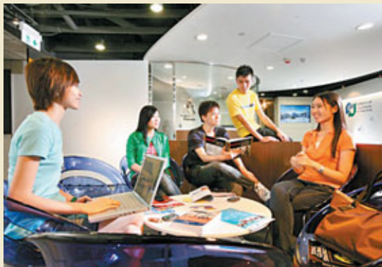
■青少年心理健康不容忽視

因而這套自我評估訓練，不只會對學生帶來學業上的心態調節，也會對他們的心理健康帶來積極的導向