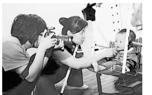
初生嬰兒最好不要拍藝術照。

第二天一大早，女兒醒了之後也不願意睜眼，並且雙眼紅腫，不停地流淚。經檢查，醫生確診女兒的眼睛是因為受到了強光照射被灼傷。