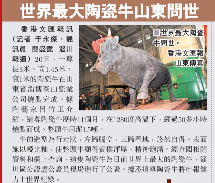
世界最大陶瓷牛山東問世

21日，哈爾濱市太陽島雪博會開園，寬24米、高27米的世界上最大的人體雪雕「天鵝湖姑娘」亮相迎接遊客。