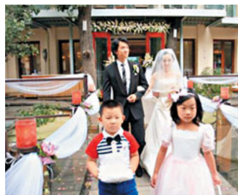
日本女嫁中國男成潮流。