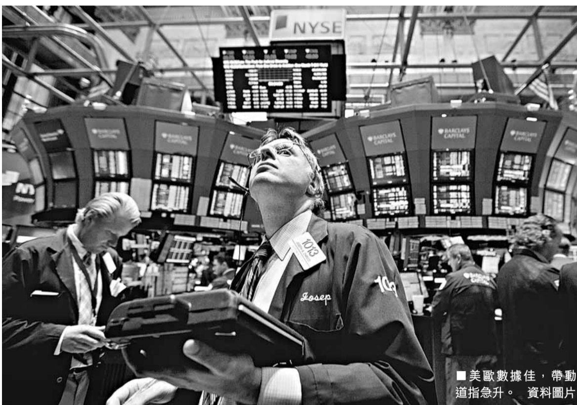
美歐數據佳，帶動道指急升。