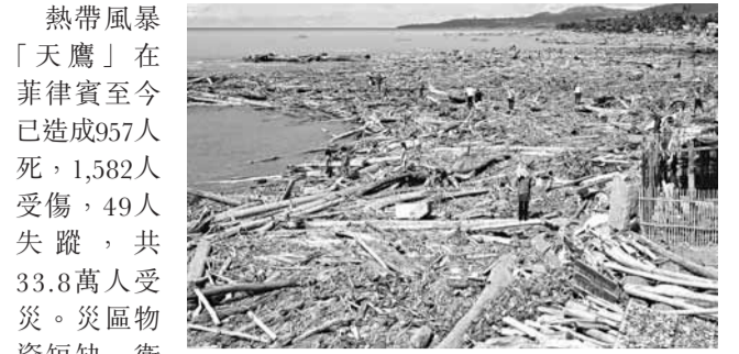
風災過後，災區滿目瘡痍。

熱帶風暴「天鷹」在菲律賓至今已造成957人死，1,582人受傷，49人失蹤，共33.8萬人受災。災區物資短缺，衛生情況堪虞，菲律賓總統阿基諾三世昨日視察南部重災區後，宣布全國進入災難狀態。