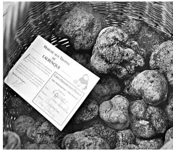
黑松露在全球暖化影響下收成大減。

松露一直受食家歡迎，但氣候暖化嚴重影響法國黑松露收成，供應愈見緊張，價格亦隨之上升。有見及此，法國業界現正密鑼緊鼓，利用地方政府提供的津貼，為松露「謀生路」。