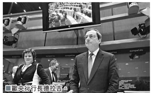
歐央行行長德拉吉。

美國商務部公布，11月份新屋動工數上升9.3%，創去年4月來高位；歐洲方面，西班牙短期國債拍賣成績好過預期，孳息大幅回落，反映市場對西國處理債務有信心，加上德國商業信心出乎意料地上升，暫時緩和歐債危機憂慮，帶動美股昨早段飆升逾200點，歐股亦大幅上揚。