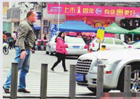
洋大叔用太極拳動作提醒司機減速慢行。

近日，一則《你有種，就從我身上撞過去》的網帖在微博上瘋狂傳播，網帖稱「一位洋大叔在斑馬線上，用自己學來的中國太極拳動作，提醒司機減速慢行」。許多網友在評論中讚揚「洋大叔」的善舉，也表示「自己很臉紅」。