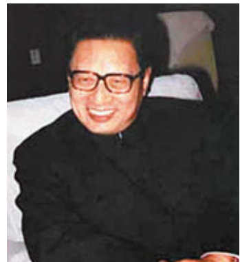
田紀雲眼中的喬石(圖)工作穩重，為人厚道。

喬石同志認為，要十分注意研究怎樣把人大搞得更民主一些，法制更完備一些。他指出：「過去，我們對法制講得比較多，對民主講得少一些。我們一些同志習慣於用簡單的辦法處理問題，一講民主就怕麻煩。要認真總結這次換屆選舉的經驗，研究怎樣使選舉更民主一些，程序更完備一些。」 「人大工作要密切聯繫群眾，越搞越民主，越搞越生動活潑，生機勃勃，千萬不要把人大搞成『長者的機關』。」