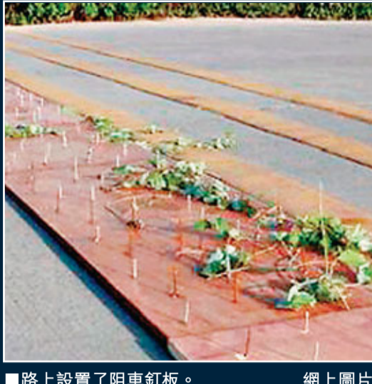
■路上設置了阻車釘板。

香港文匯報訊（記者 敖敏輝 汕尾報導）廣東省汕尾市陸豐烏坎村事件尚未平息，各種傳言充斥網絡及報章，令事態發展陷入一團迷霧當中。汕尾市委書記鄭雁雄昨日表示，並沒有軍警進入烏坎村，亦從未對該村斷水斷電。目前，工作組仍難以進村，仍在尋求解決方法。汕尾市委宣傳部相關負責人亦透露，當局今後不會安排軍警進入烏坎村。