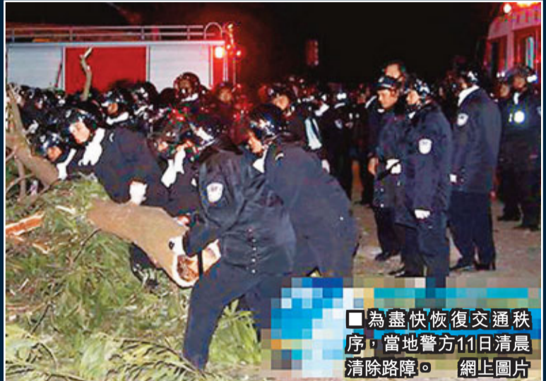
■為盡快恢復交通秩序，當地警方11日清晨清除路障。 網上圖片

記者獲悉，該事件已經由陸豐市政府移交汕尾市委、市政府解決，18日起，汕尾市委書記鄭雁雄帶領相關部門負責人與村民代表見面，進行安撫並表達解決問題的誠意，其中包括烏坎村村民、學生及教師等，據稱幹群共約500人參加見面會。