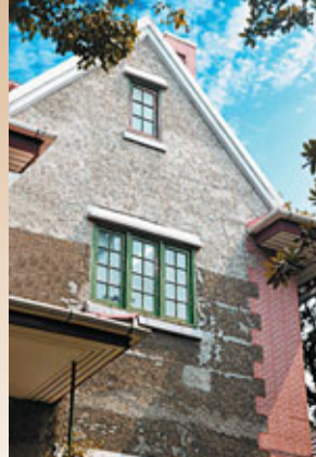
圖為新華村董竹君舊居

愚園路新華村住宅現位於愚園路1320弄，建於1925年，佔地11500平方米，有英國式獨立大花園洋房5幢。住宅具有典型的英國城市別墅的特點，底層有附屬用房和車庫，直達二樓的室外樓梯，門窗套和建築隅石包角的水紅磚勾縫，乾黏河卵石外牆面，坡屋面上的老虎窗，這些都是愚園路新華村住宅的主要特點。原新華村1號，現在的愚園路1294號，為上世紀傑出的女權運動代表、女實業家、聞名遐邇的錦江飯店創始人董竹君1948-1950年的舊居。