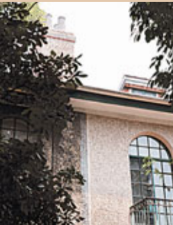
圖為安定坊一隅——傅雷舊居

我國翻譯界的一代巨匠，傑出的文藝家傅雷從1949年始就寓居安定坊5號。這是一個獨院，一幢白色的二層聯列式獨立花園住宅掩映在綠茵裡，入口前的院子裡鋪着灰白色的地磚，兩三棵大樹在院子一角。平瓦陡坡屋頂錯落有致，使人不由自主聯想到傅聰擅長的音階。南面有近100平米的小花園，種有棕櫚、水杉、石榴、香樟等樹木。