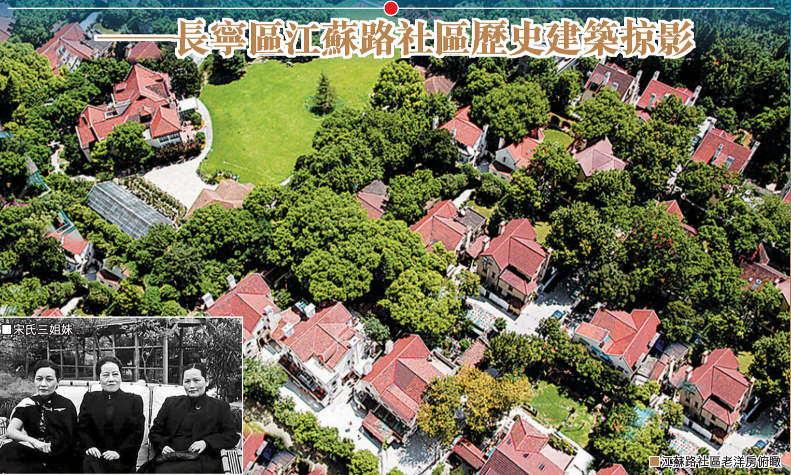
江蘇路社區老洋房俯瞰

桃源坊51號和53號是民主革命鬥士沈鈞儒先生故居。沈鈞儒先生於光緒三十年末科進士。1936年11月23日，沈鈞儒先生在此寓所遭公共租界巡捕房逮捕，是謂聞名全國的「七君子事件」。說鈞儒先生是「民主人士的左派旗幟」、「愛國知識分子的光輝榜樣」，這是對他一生貼切的概括。建國後，鈞儒先生出任中央人民政府最高法院院長，為建國初期建立人民的法制體系，鞏固人民民主專政，做出了很大貢獻。