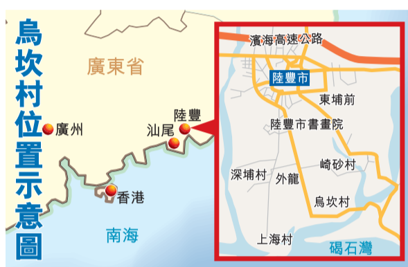
烏坎村位置示意圖

對於政府封鎖烏坎村並斷水斷電的傳聞，鄭雁雄表示，因擔心警察抓人，組織者對村民的活動進行了一些限制，致使村民外出不通暢，這在一定程度上影響了村