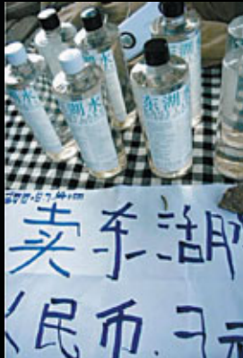
■魏源的裝置作品《販賣東湖水》