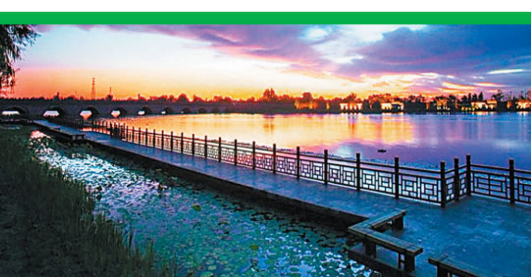
■親水長廊——治理工程設計理念的重要成果。 資料圖片