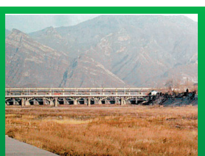
■治理前的門城湖