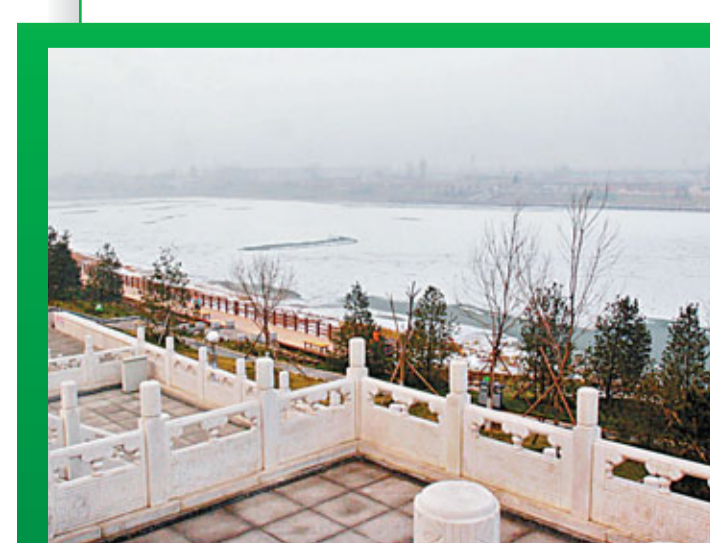
■治理後的門城湖