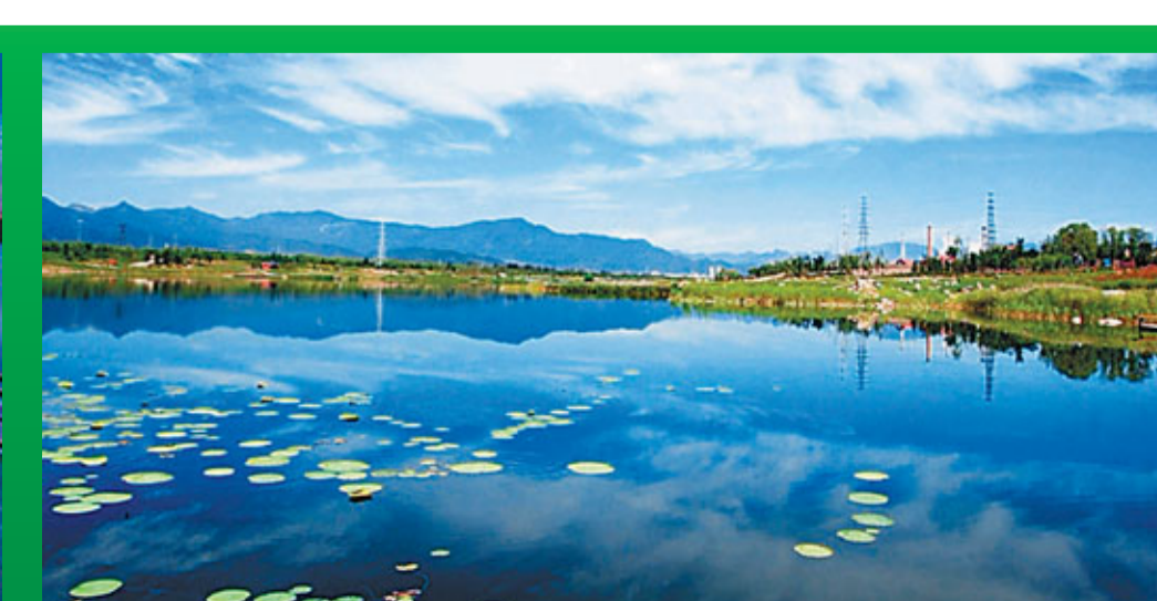
■親水長廊——治理工程設計理念的重要成果。