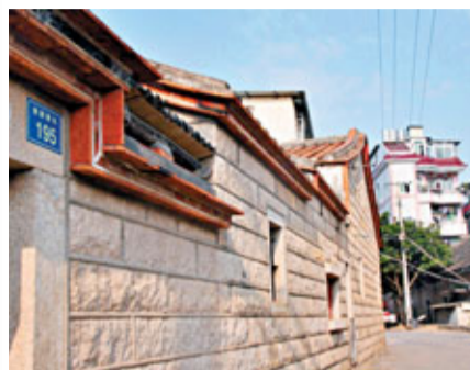
■黃厝村內新舊民宅錯落，十年前租客多是台灣人。

直到警察找上門來，村民才恍然大悟：當年爽快租下自己房屋的台灣同胞，看中的便是這唾手可得且不產生漫遊費用的台灣手機信號。全村的台灣租客，職業全是「打電話」。他們借由秘密設置在租屋中的天線接收覆蓋至黃厝村的台灣手機信號，經過無線功率放大器加強信號後供多人同時撥打作業。冒充商場、電話公司甚至色情服務公司等角色致電回台灣，以中獎、返還話費等利益相誘惑，要求對方先行繳納一定比例的稅金。