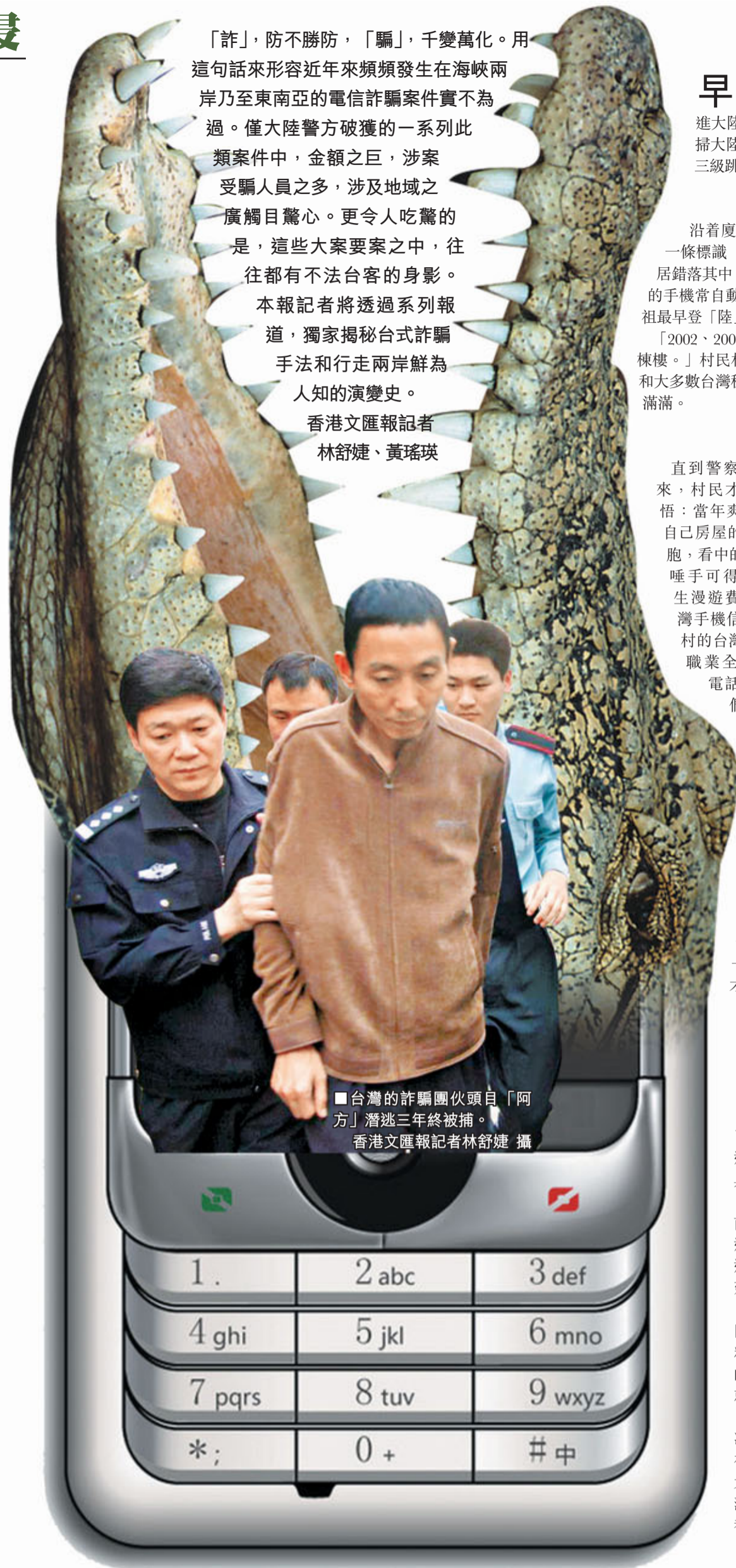
■台灣的詐騙團伙頭目「阿方」潛逃三年終被捕。