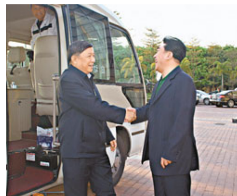
■高敬德(右)與徐冠華。

香港文匯報訊 全國政協教科文衛體委員會主任徐冠華、副主任于永湛、副主任劉長樂、副主任江紹高、副主任楊勝群、副主任陳曉光、副主任胡家燕、副主任王全書、副主任胡振民率赴深考察組一行27人，在新恒基集團主席高敬德、全國僑聯常委姚志勝、深圳市政協副主席林潔及市政協文化文史委