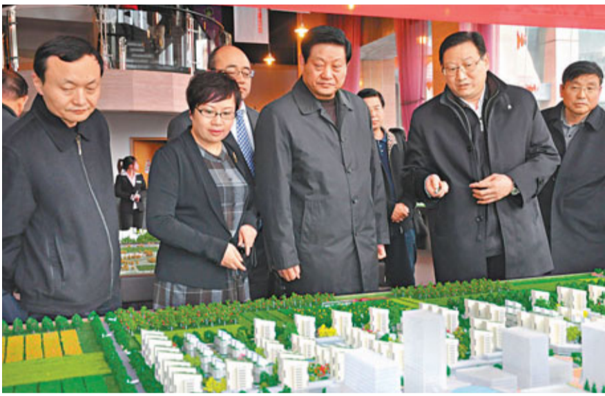
■陝西省省長趙正永在副省長、西咸新區管委會主任江澤林、西咸新區管委會常務副主任王軍，管委會副主任、總規劃師李肇娥等陪同下調研西咸新區。

西咸新區常務副主任王軍介紹說，西咸新區加快城鄉統籌步伐，通過文化、休閒、旅遊、生態等方式提高農產品附加值，打造現代農業示範區和「莊園