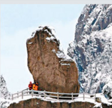
■黃山飛來石景點冬景。

香港文匯報訊(記者 張長城 黃山報道) 安徽黃山冬季旅遊促銷本月初正式啟動，主推「覽勝遊、體驗遊、休閒遊」三個主打產品，以營銷黃山自然風光、徽州文化和溫泉等休閒景點。黃山旅遊股份有限公司表示，黃山去年冬遊接待遊客23.6萬人，今年將力爭達到25萬人，增長6%。同時將大力拓展高端商務市場，提升遊客綜合消費能力，實現更大經濟效益。