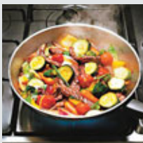
■與「味道配對」的西菜不同，中菜會避免使用兩款味道相近的食材。