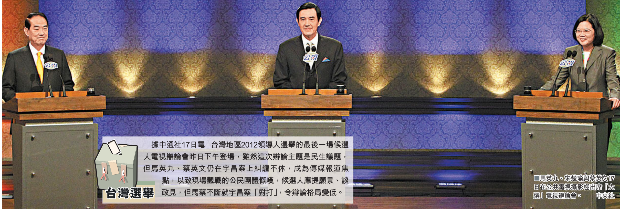
馬英九、宋楚瑜與蔡英文17日在公共電視攝影棚出席「大選」電視辯論會。

據中通社17日電 台灣地區2012領導人選舉的最後一場候選人電視辯論會昨日下午登場，雖然這次辯論主題是民生議題，但馬英九、蔡英文仍在宇昌案上糾纏不休，成為傳媒報道焦點，以致現場觀戰的公民團體慨嘆，候選人應提願景、談政見，但馬蔡不斷就宇昌案「對打」，令辯論格局變低。